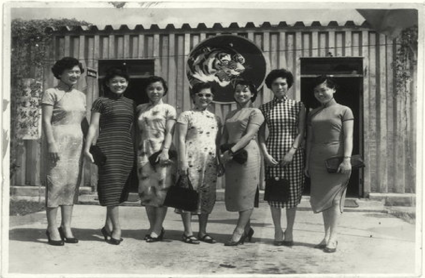
空勤大隊長的鐵皮屋辦公室外，衣著樸素的飛行員的太太們。