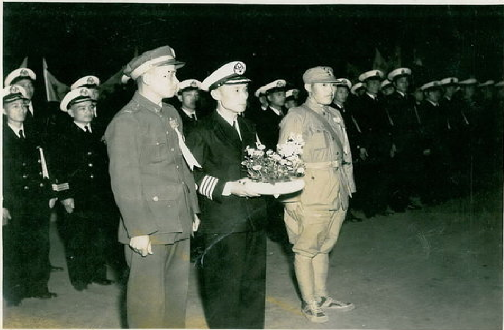
克勤克儉的軍人，從穿在腳上的球鞋，即可知當年那種物力維艱的歲月。