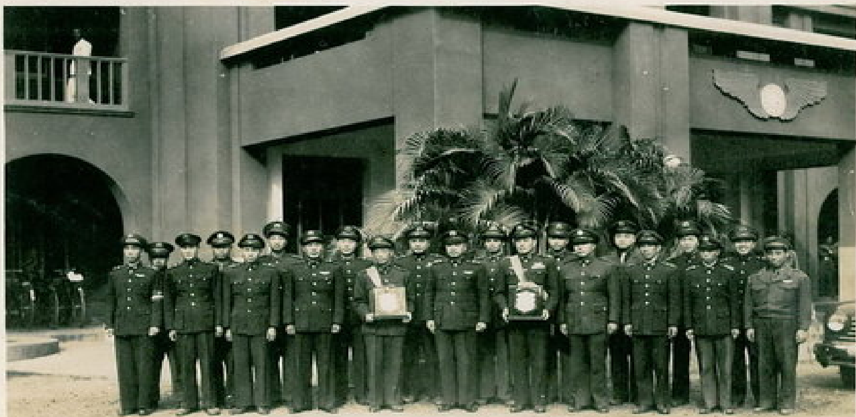
即將北上接受表揚的克難英雄，走過泥巴地向同僚們致謝！