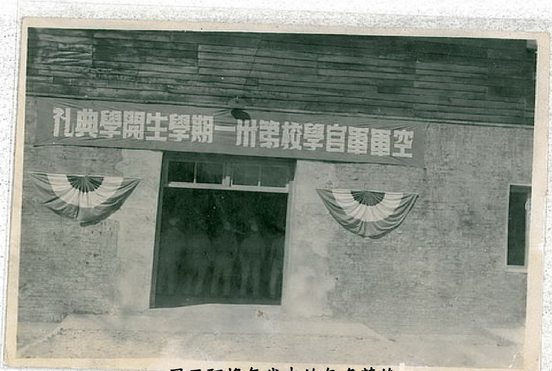
風雨飄搖年代中的無名英雄