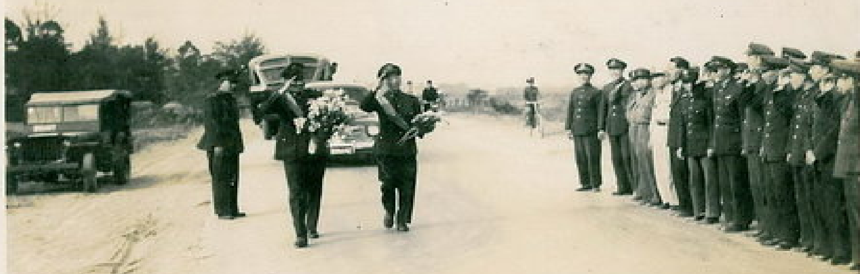
即將北上接受表揚的克難英雄，走過泥巴地向同僚們致謝！