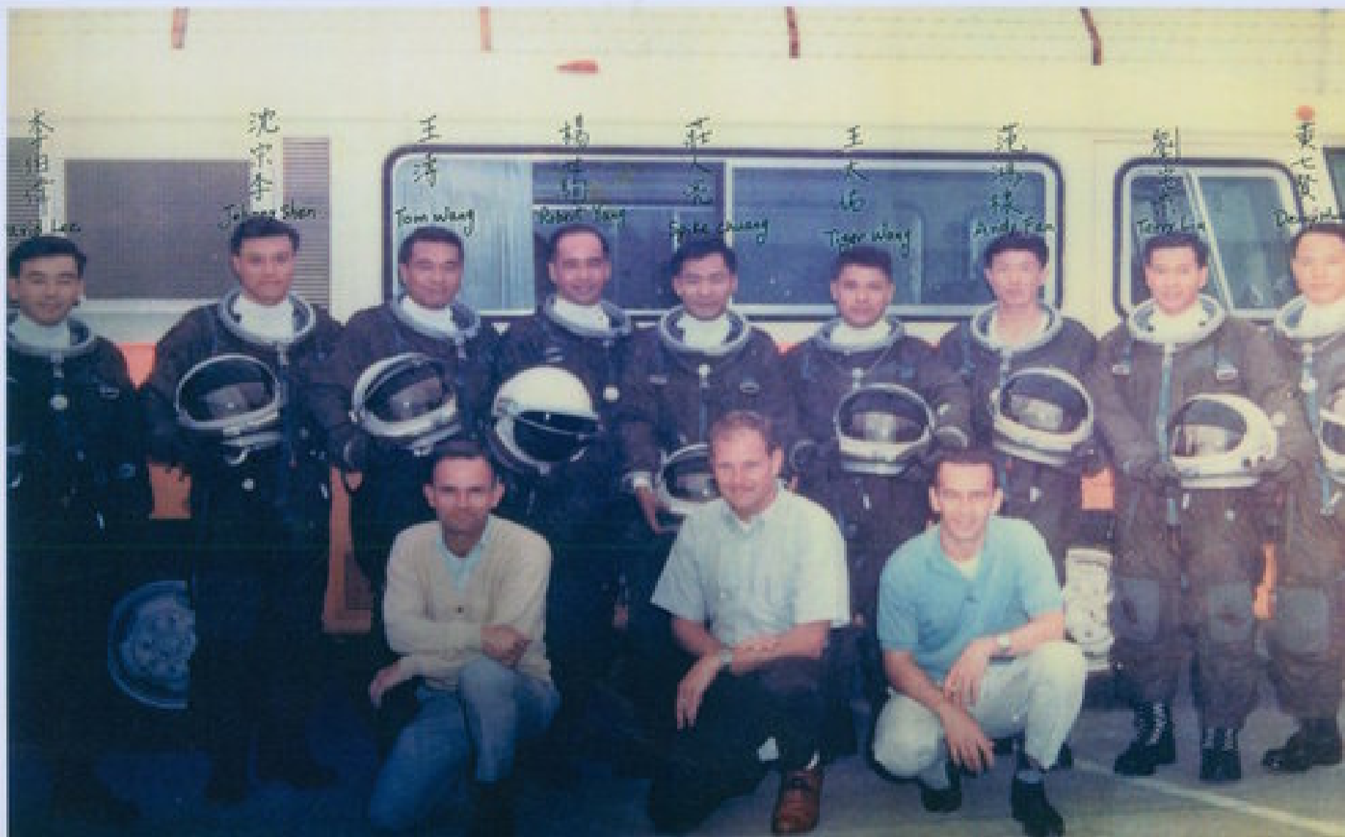
黑貓中隊中美雙方人員合影留念，中方人員