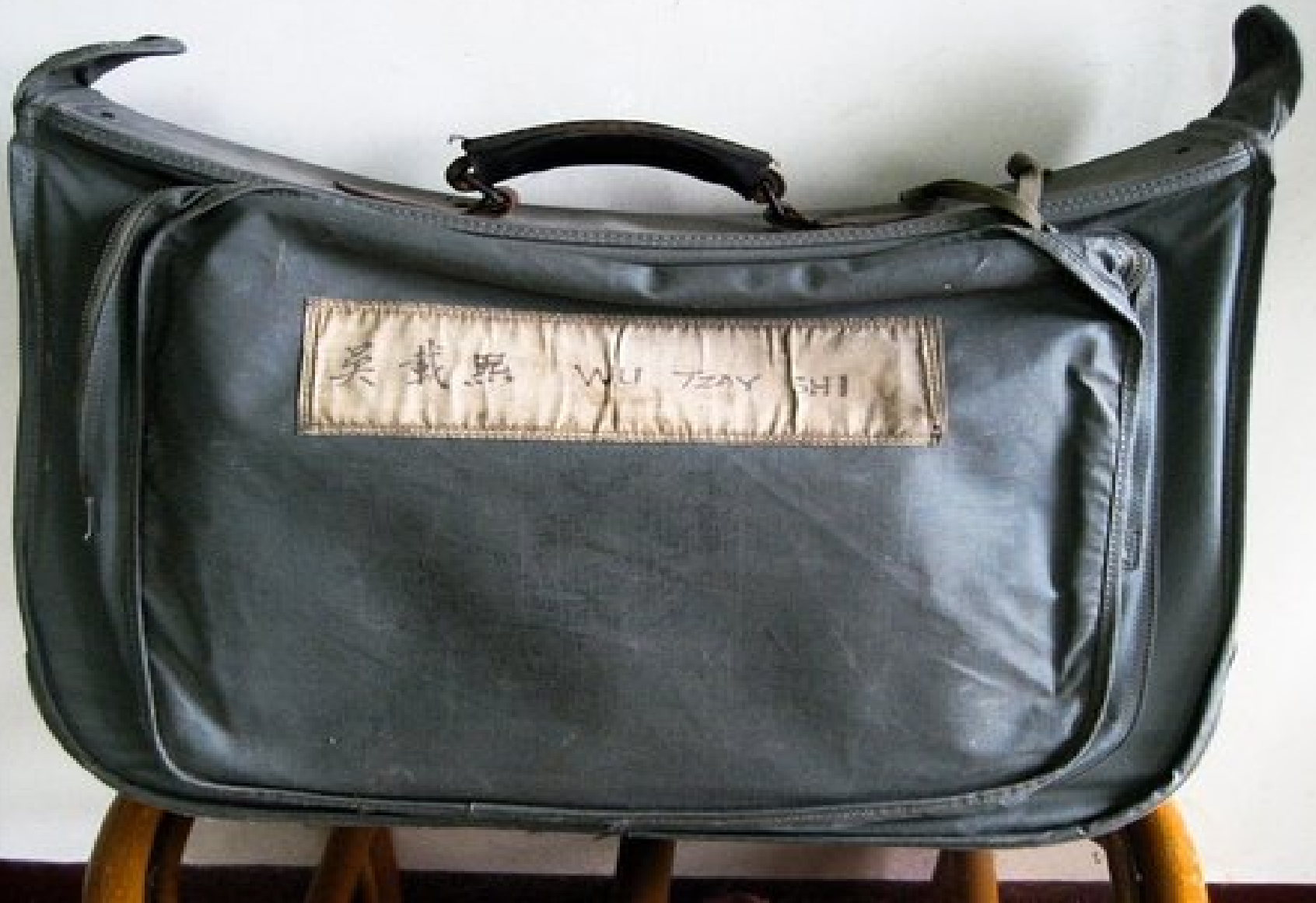
在美接受u2訓練時的行李袋