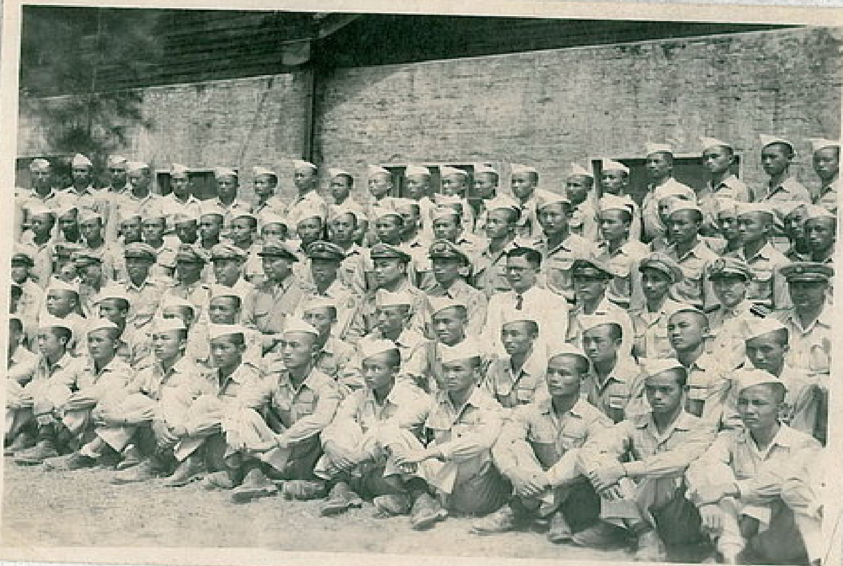
在那個風雨飄搖的艱困歲月中，他們投身軍旅，立志報國。