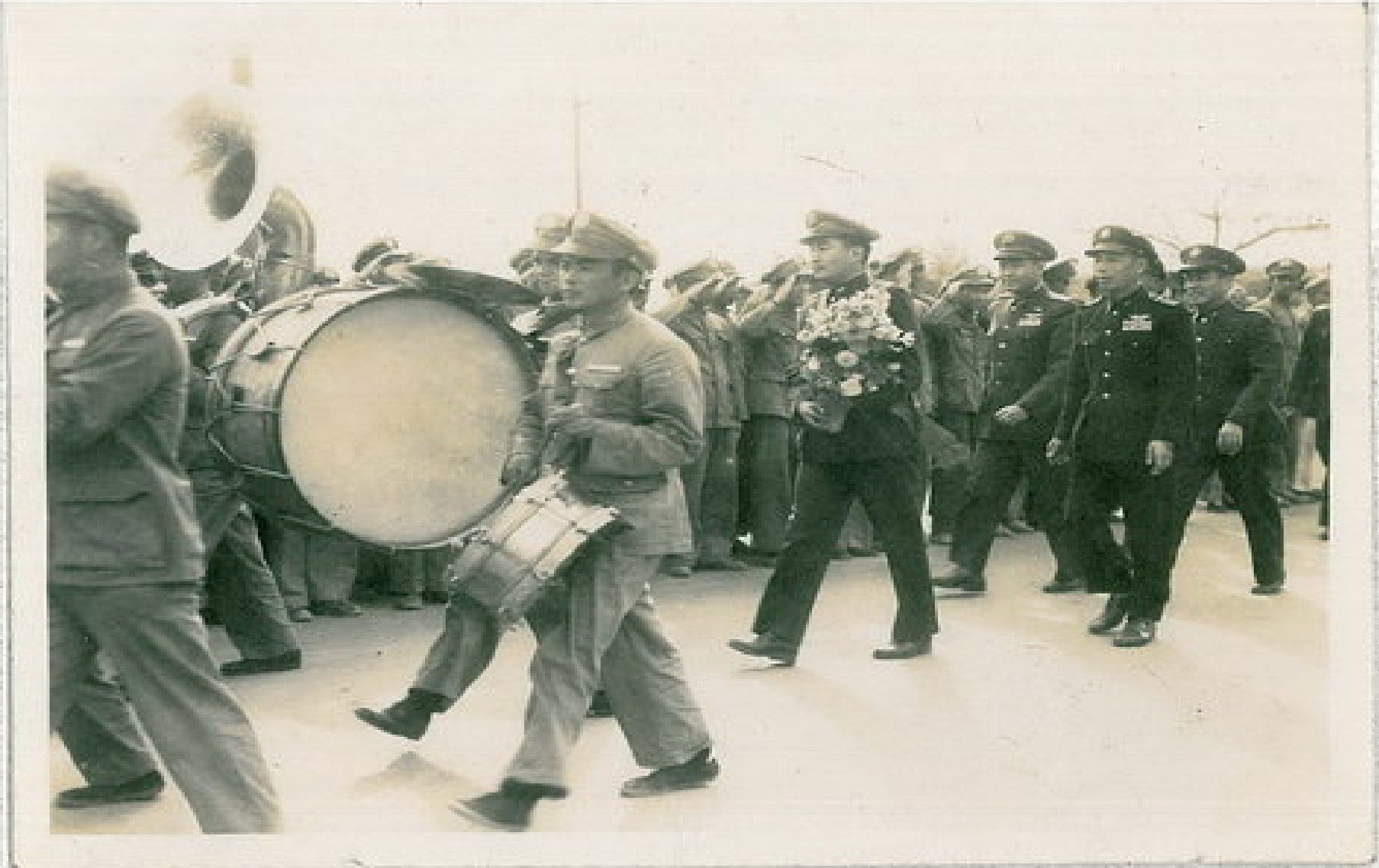
從軍樂隊人員的黑布鞋來遙想當年的艱困歲月