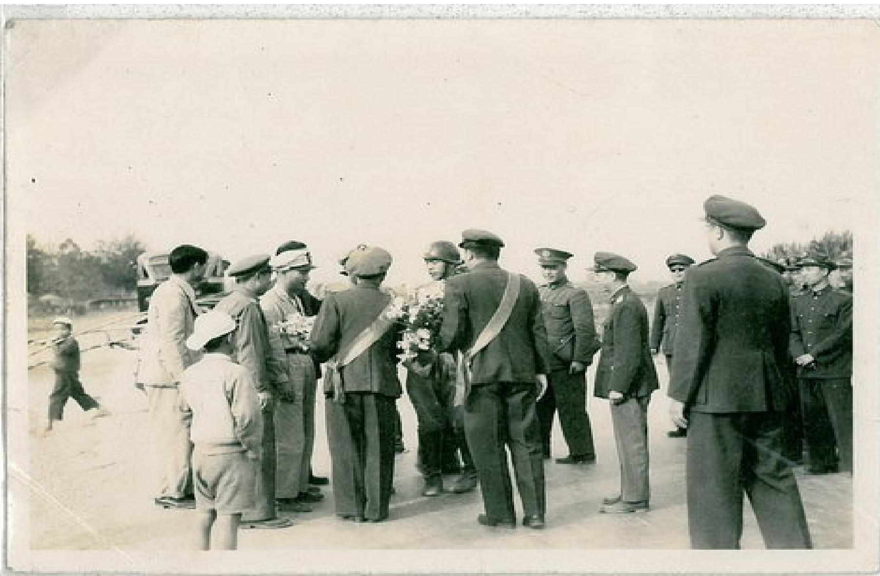
當年打赤腳的孩童走過尚是泥土路營舍門前