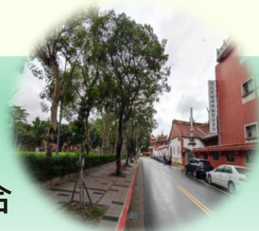
減法美學示意照片_大龍國小旁行人道