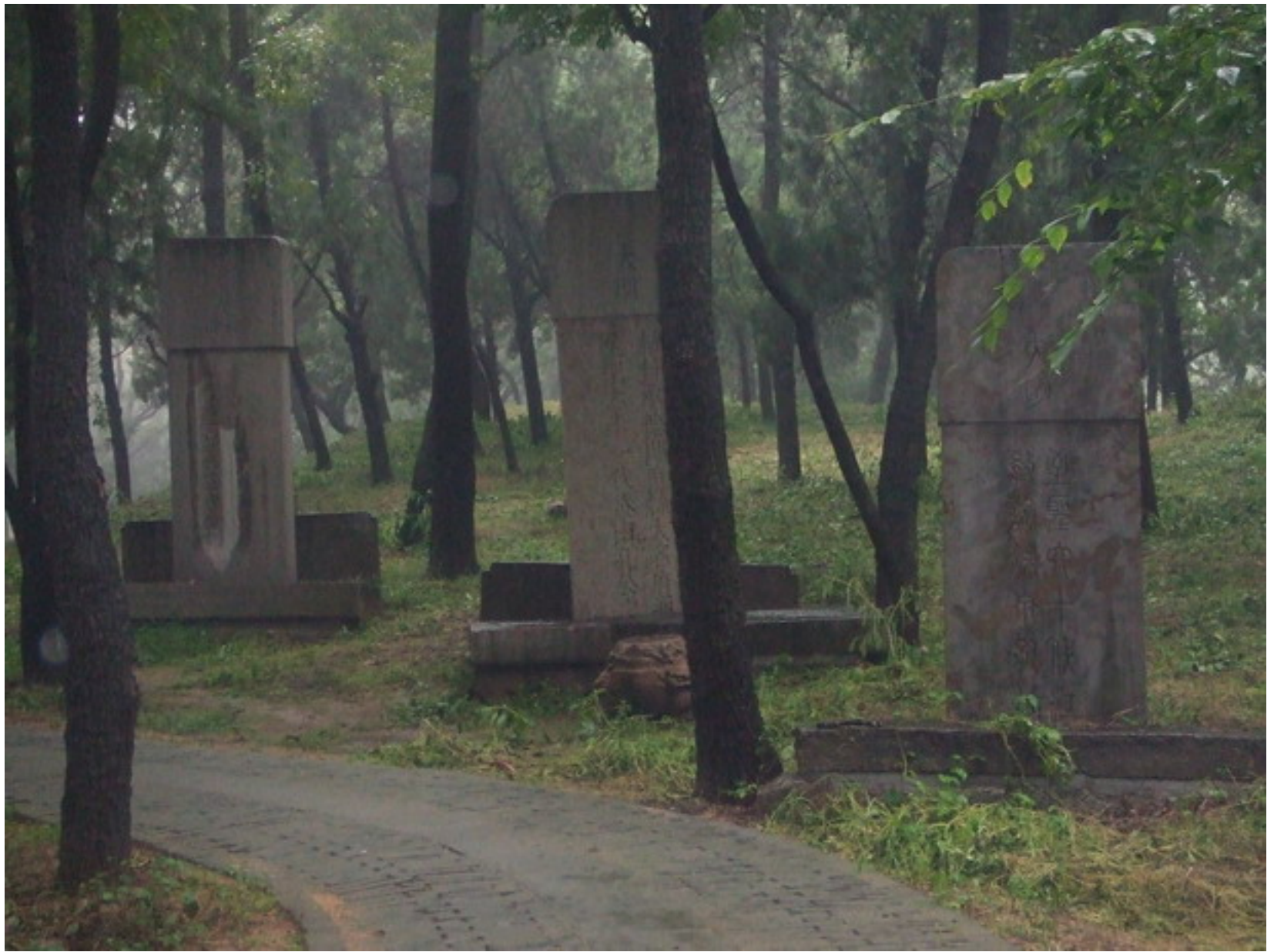
孔林中，處處可見後代孔家子孫之墓碑。