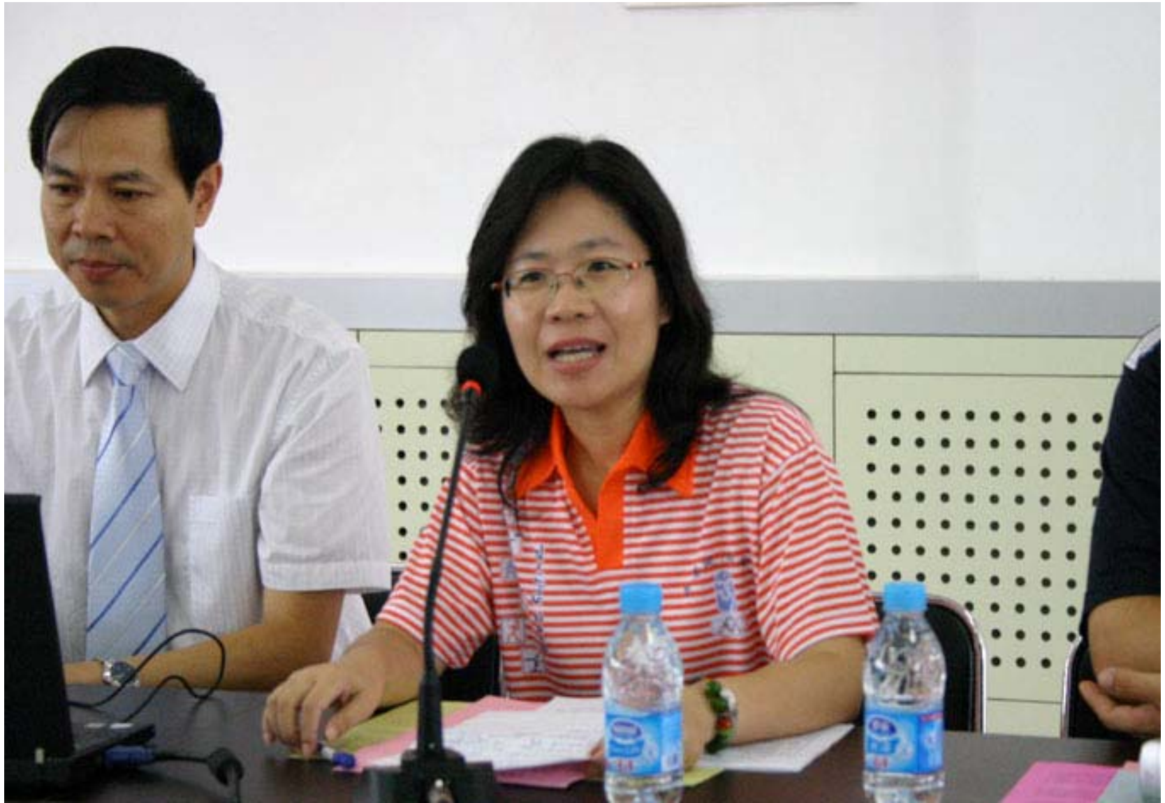
領隊代表致辭（左邊是濟南一中馬校長）