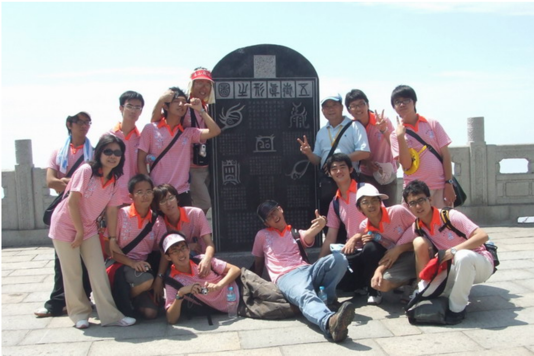
在泰山『五行碑石』前合影