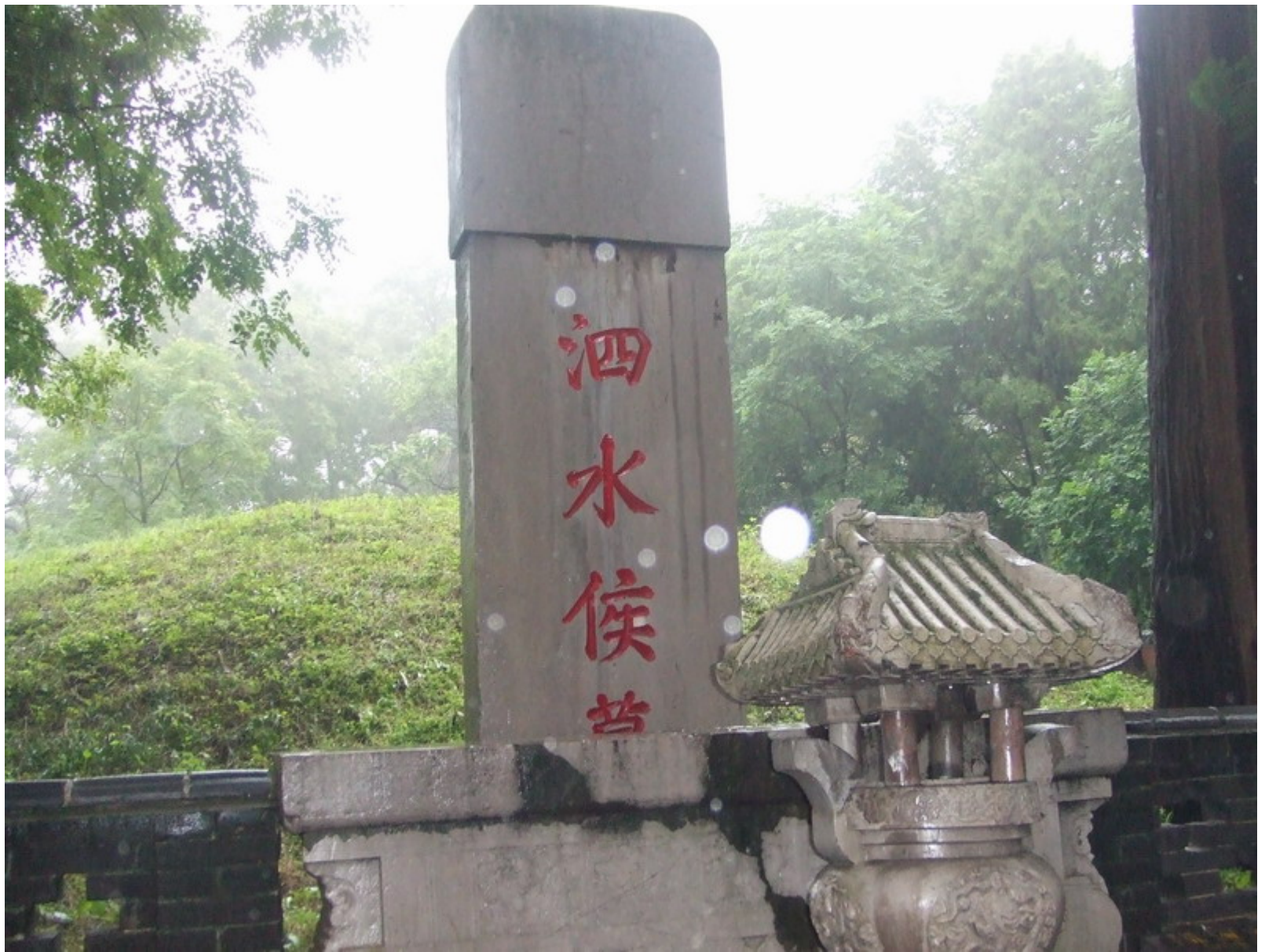
孔子墓東側為其子泗水侯孔鯉之墓。