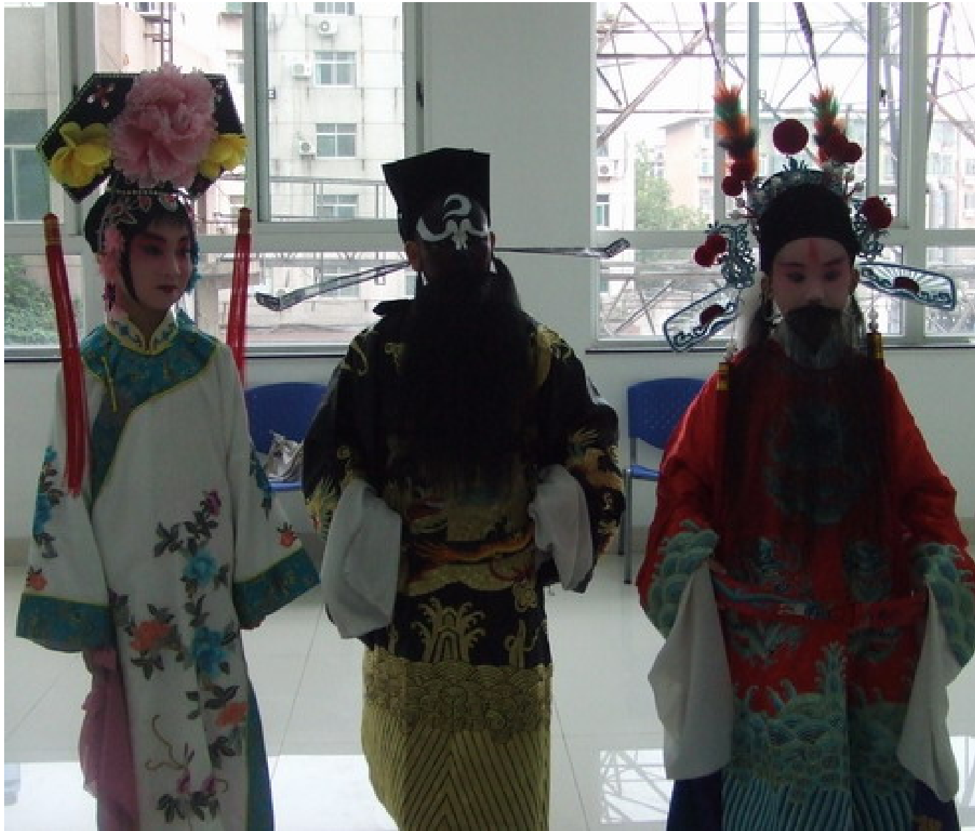
這些十歲的孩子，正在表演京劇「四郎探母」。