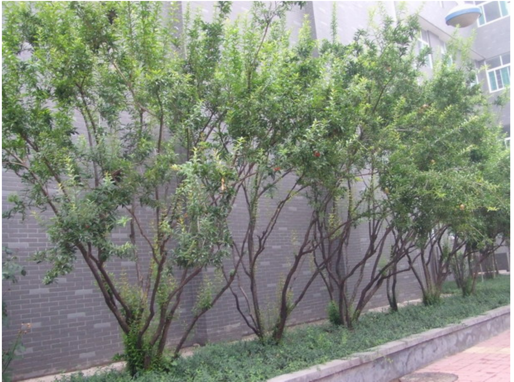
「紅榴白蓮，羅生池砌」之紅色石榴花