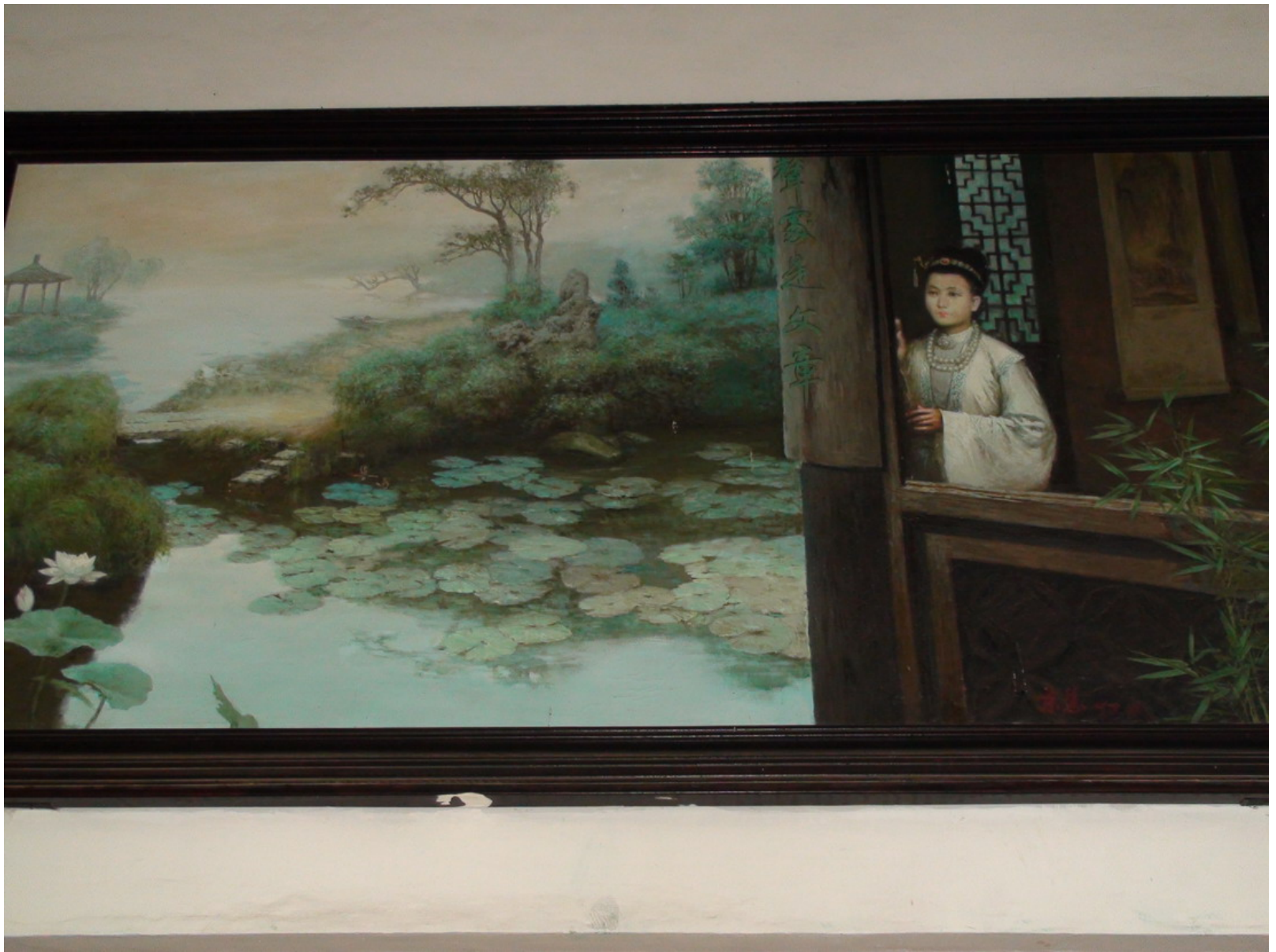
櫺窗內展示著詞作、平生事蹟介紹、畫像和後人吟詠等。