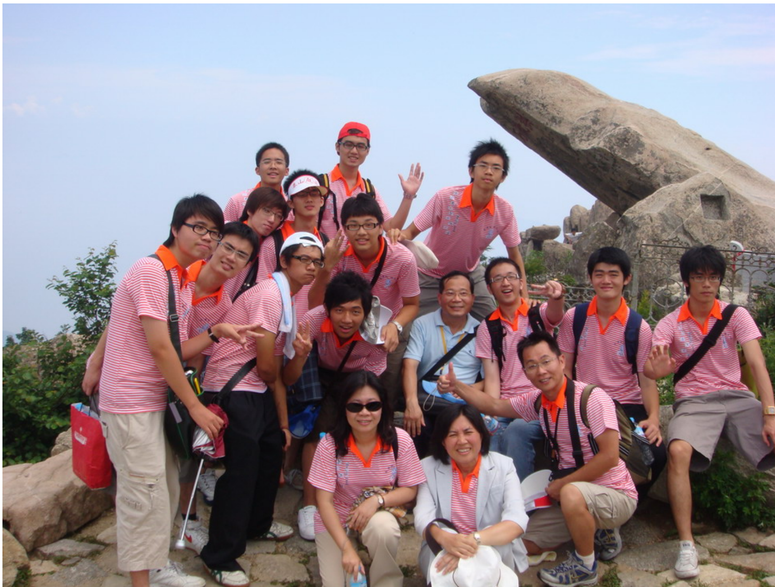
在青蛙石前，全體快樂地合影，一個都不少。