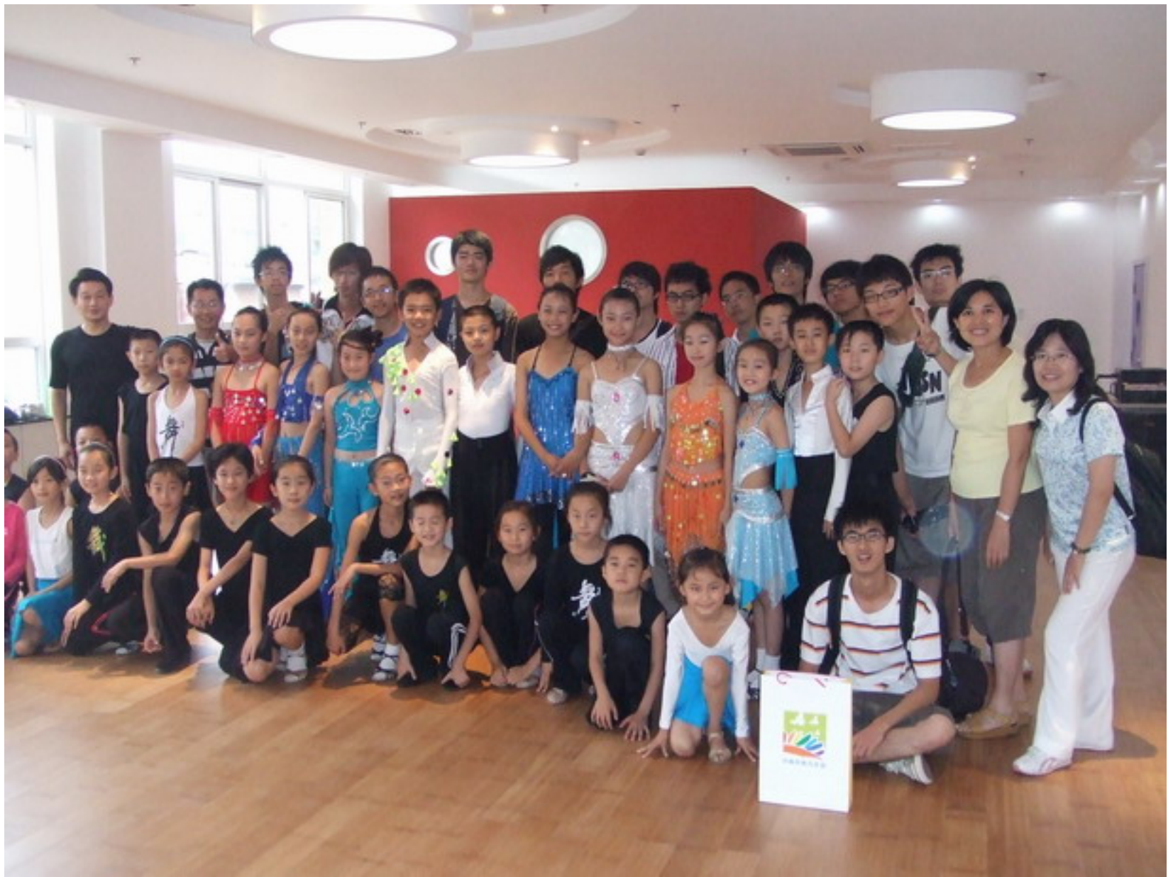
與充滿熱情的拉丁舞小學員合影