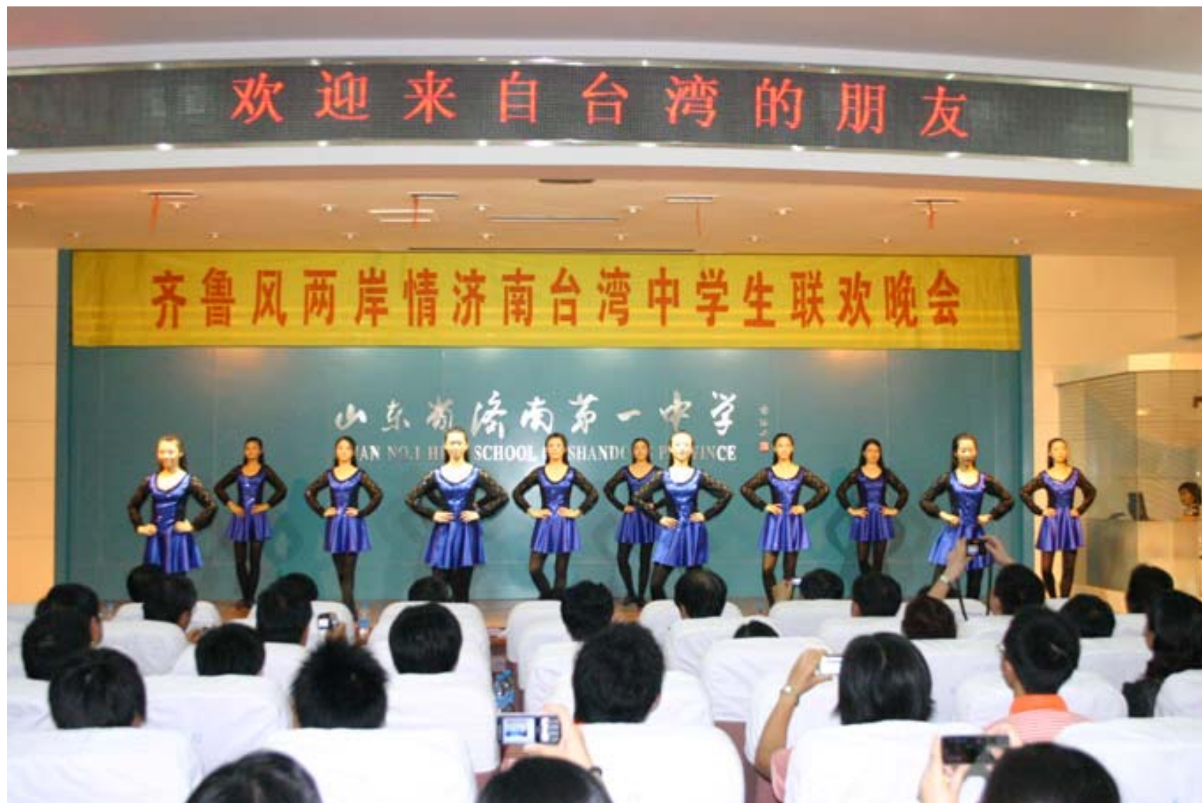
濟南一中學生舞蹈表演