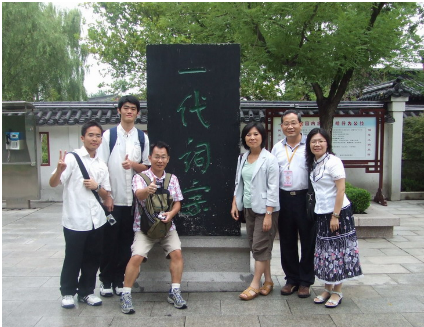
我們在此感受女詞人當時的溫婉氛圍