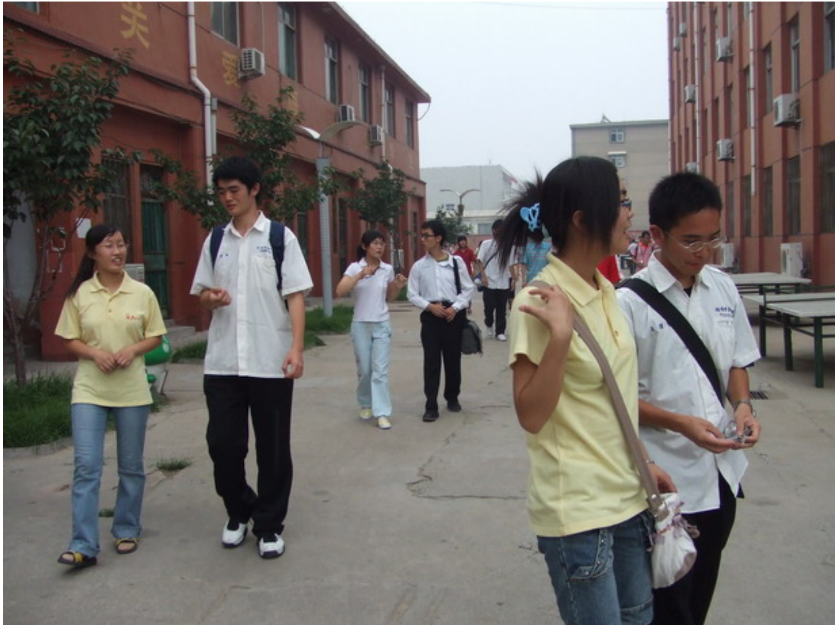
與泰安二中的同學交流