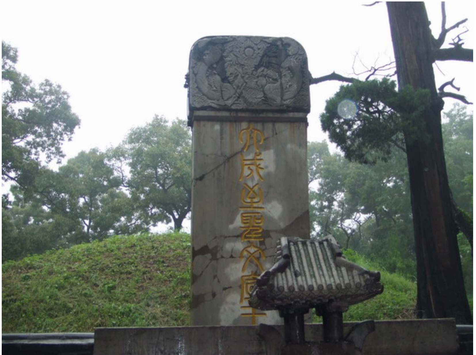
孔子墓，是孔林的中心所在。巨碑上『大成至聖文宣王墓』，是明朝時篆刻的。