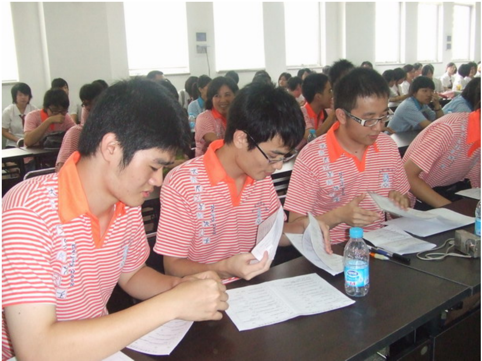
同學們翻閱資料幫助隊友搶答