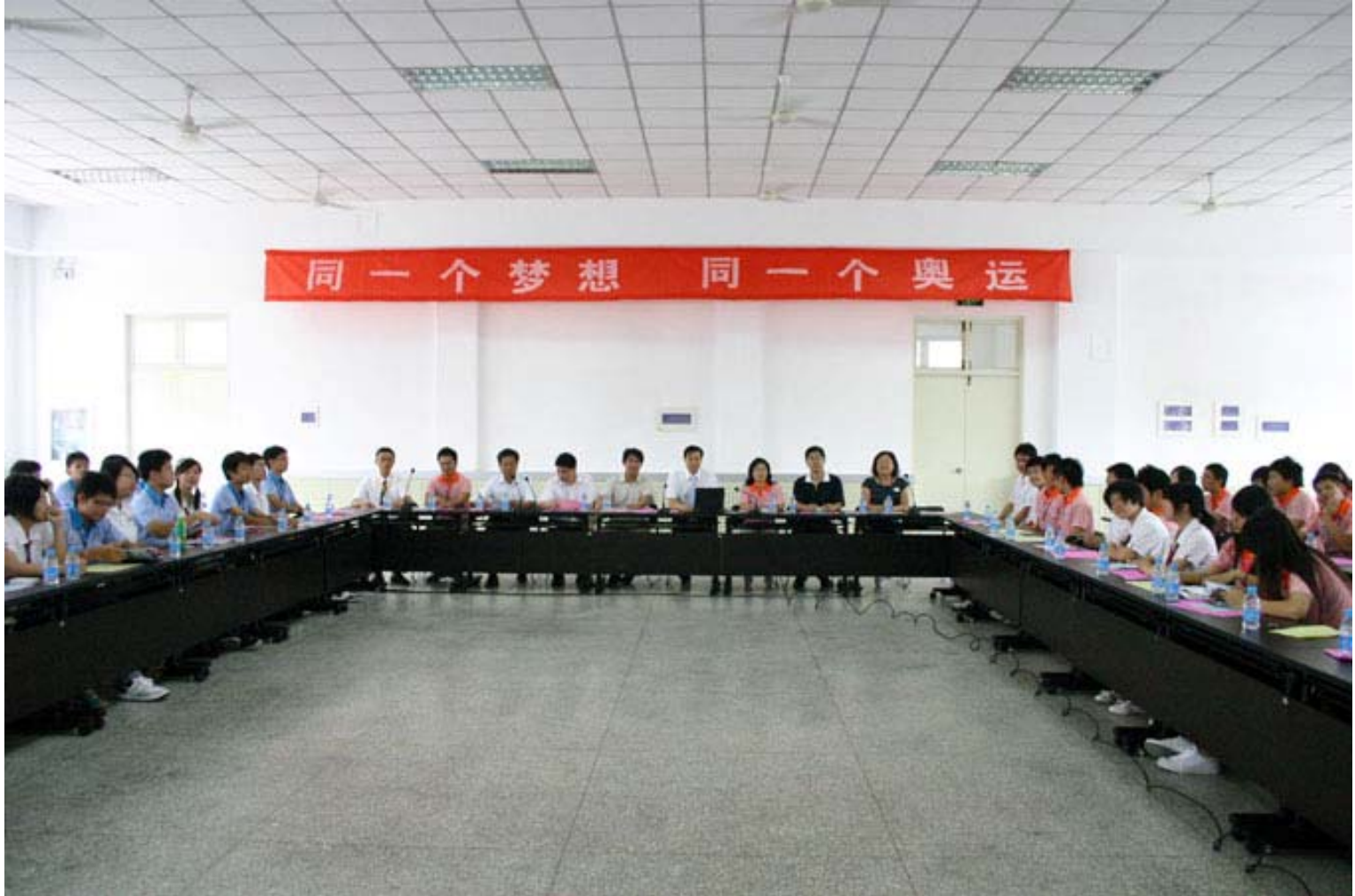
濟南一中歡迎會場