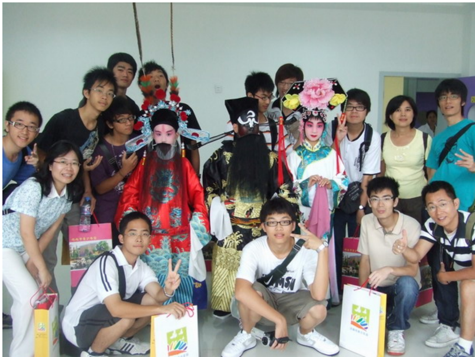
扮相俊美、唱作俱佳的小演員，真討人喜歡！