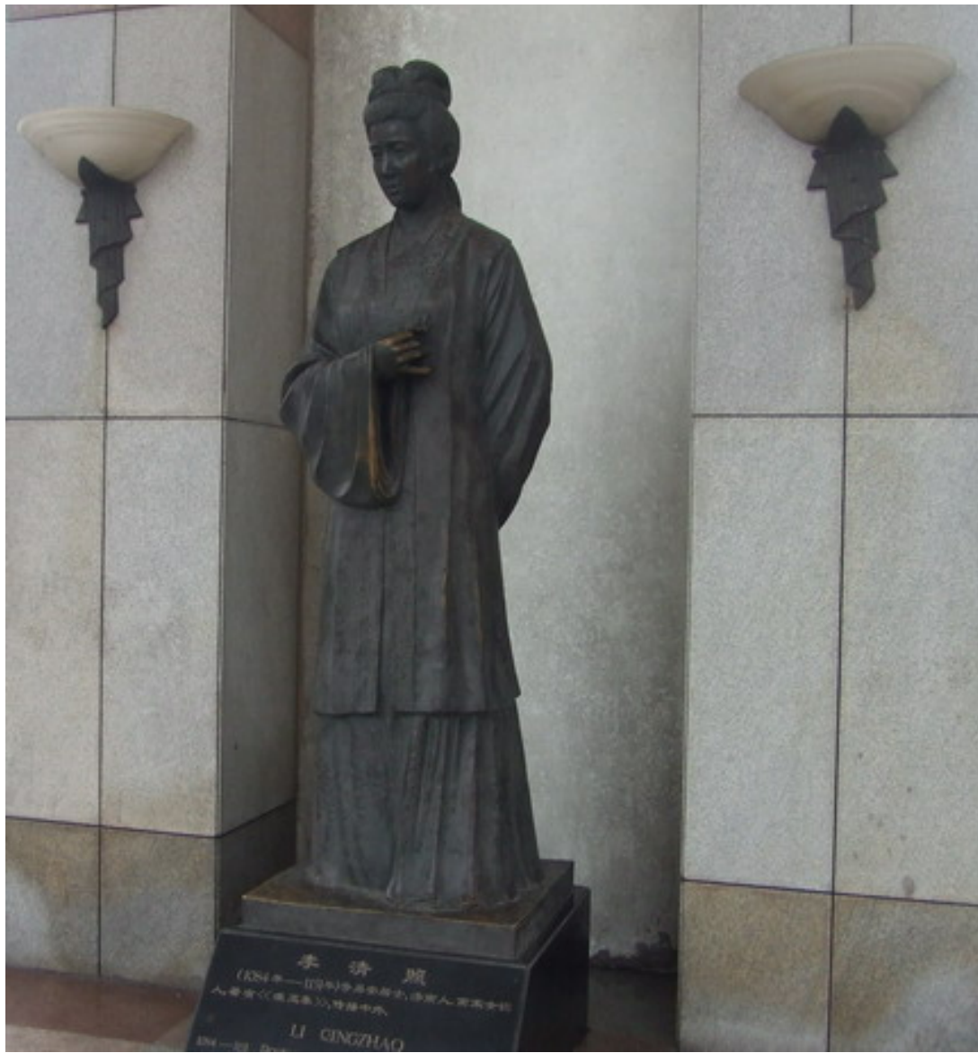
李清照婉約神情凝視遠方， 國憂，家愁，人比黃花瘦