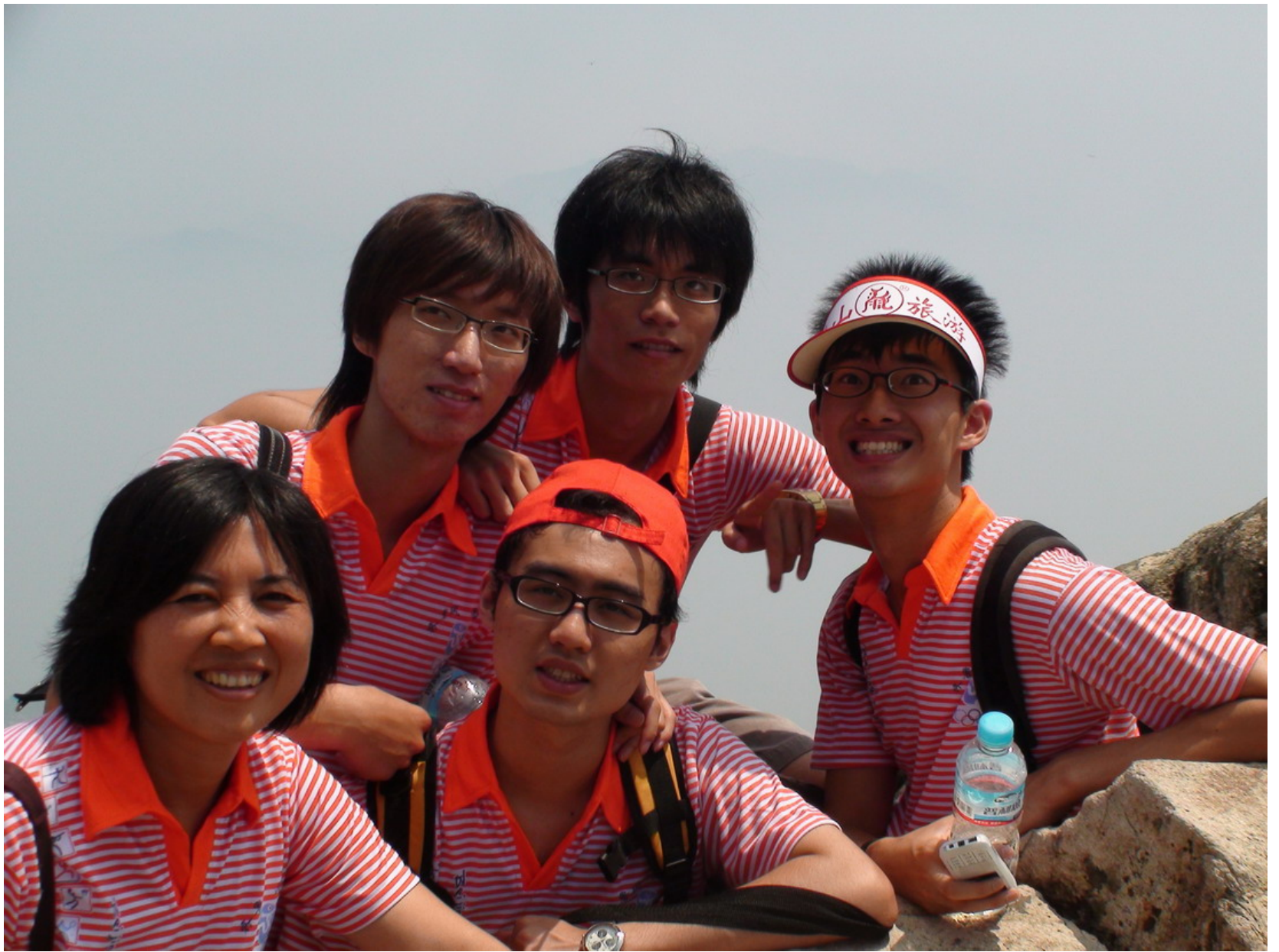
致伶老師與四位高足 — 優秀的個人，來自優秀的團體。