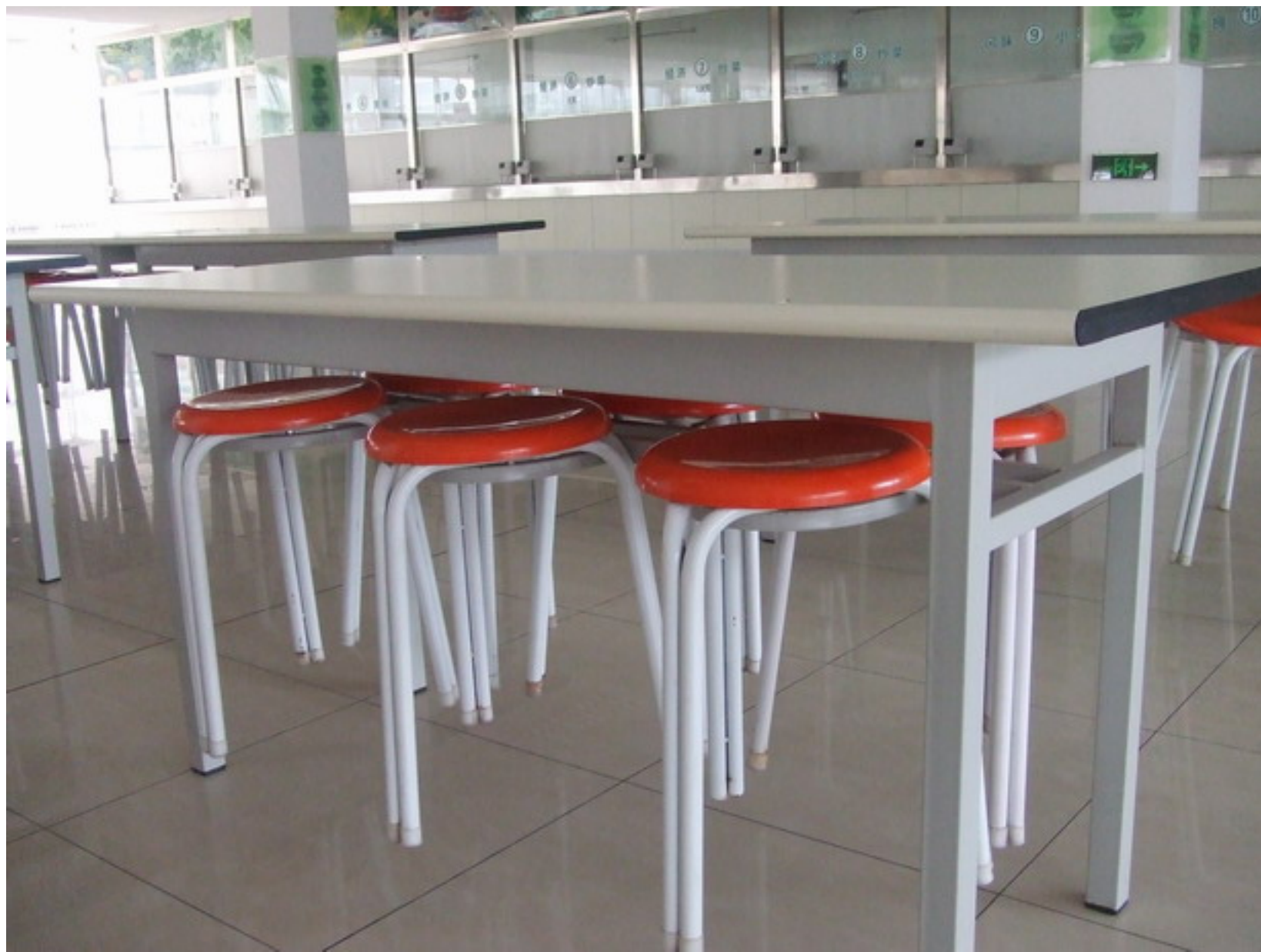
學校自行設計的餐桌椅