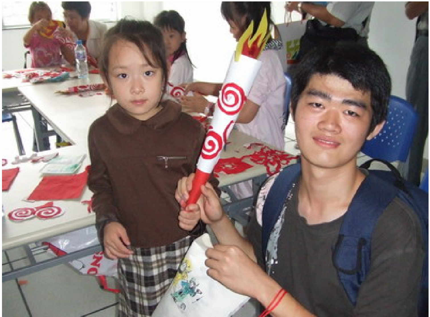
大方可愛的小女孩將剛做好的奧運『火炬』，送給小姚明。