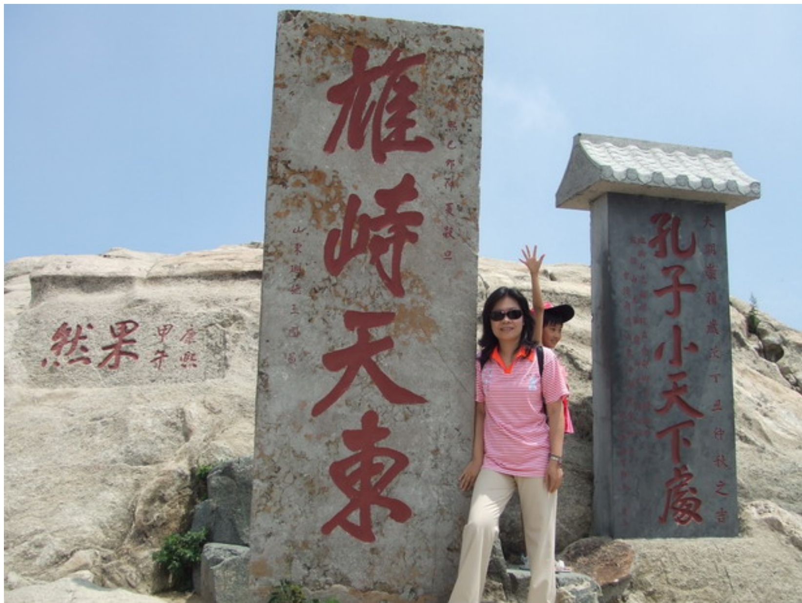
『孔子小天下處』，『果然』『雄峙天東』。