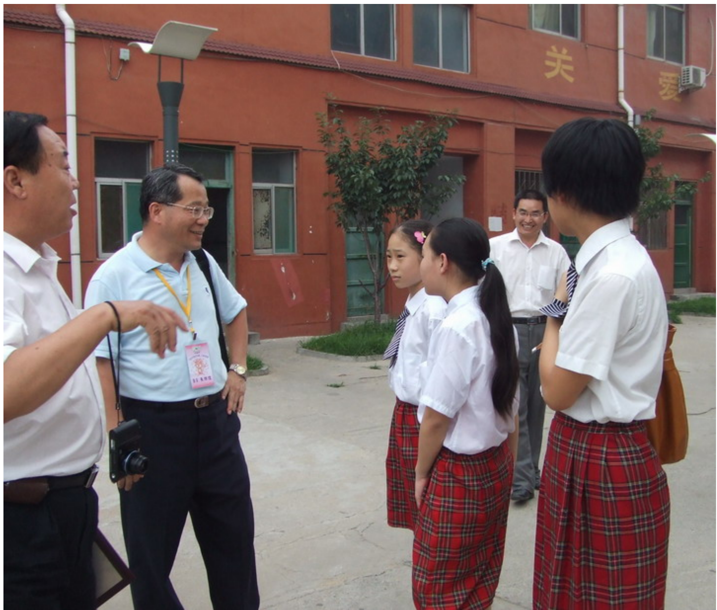
校長詢問泰安二中學生的學習情形