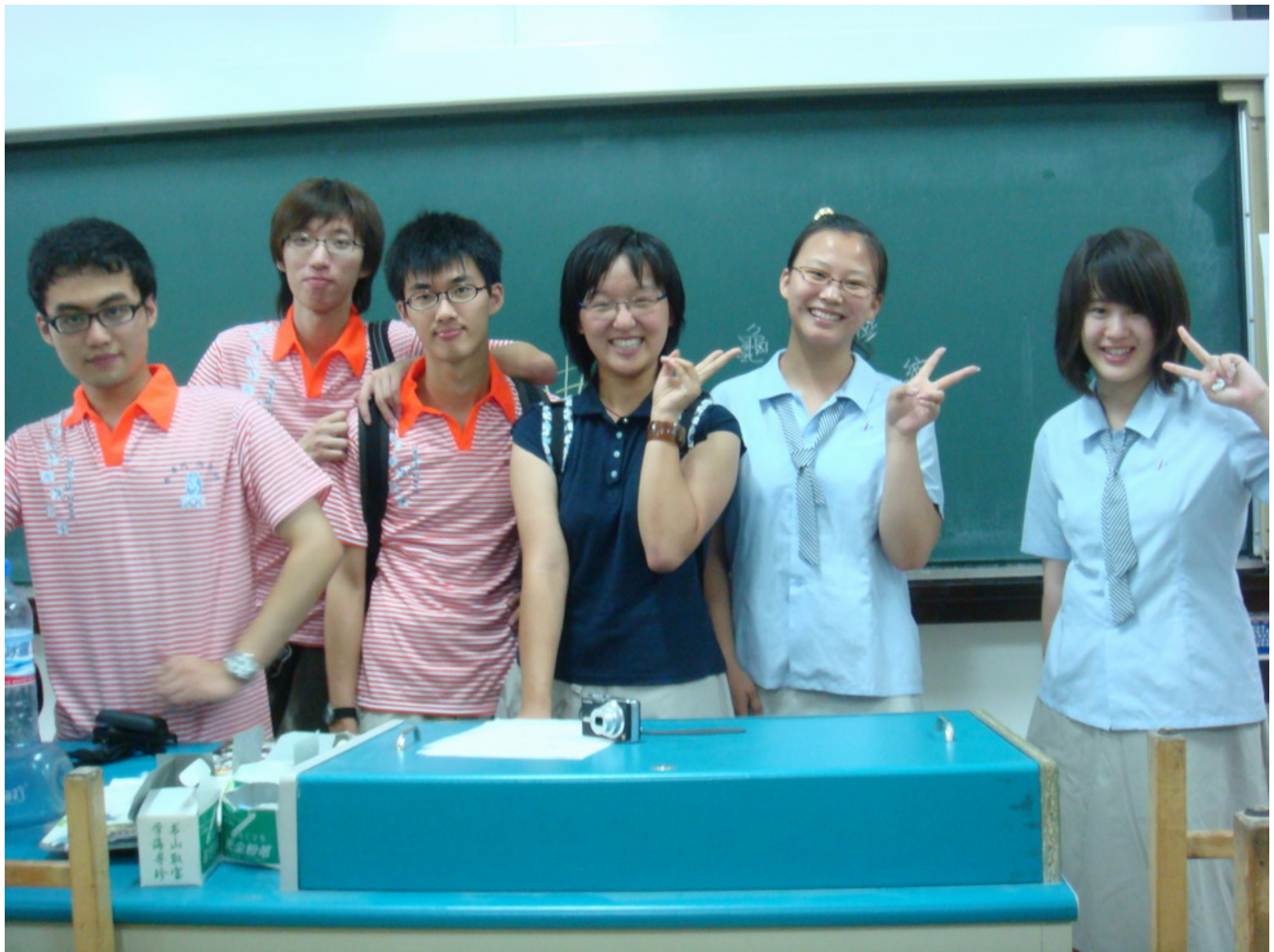
參觀教室（黑板有水幕擦拭）