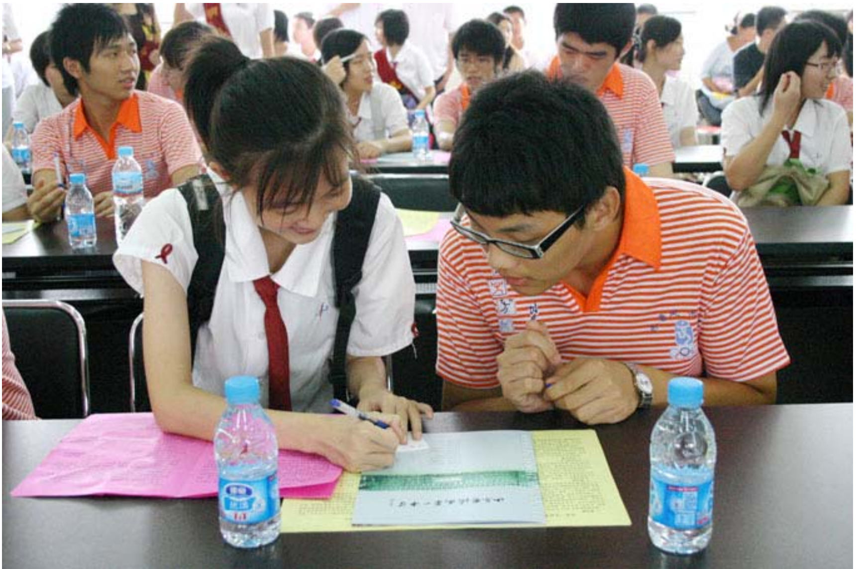
濟南一中為我們每個人安排一位partner