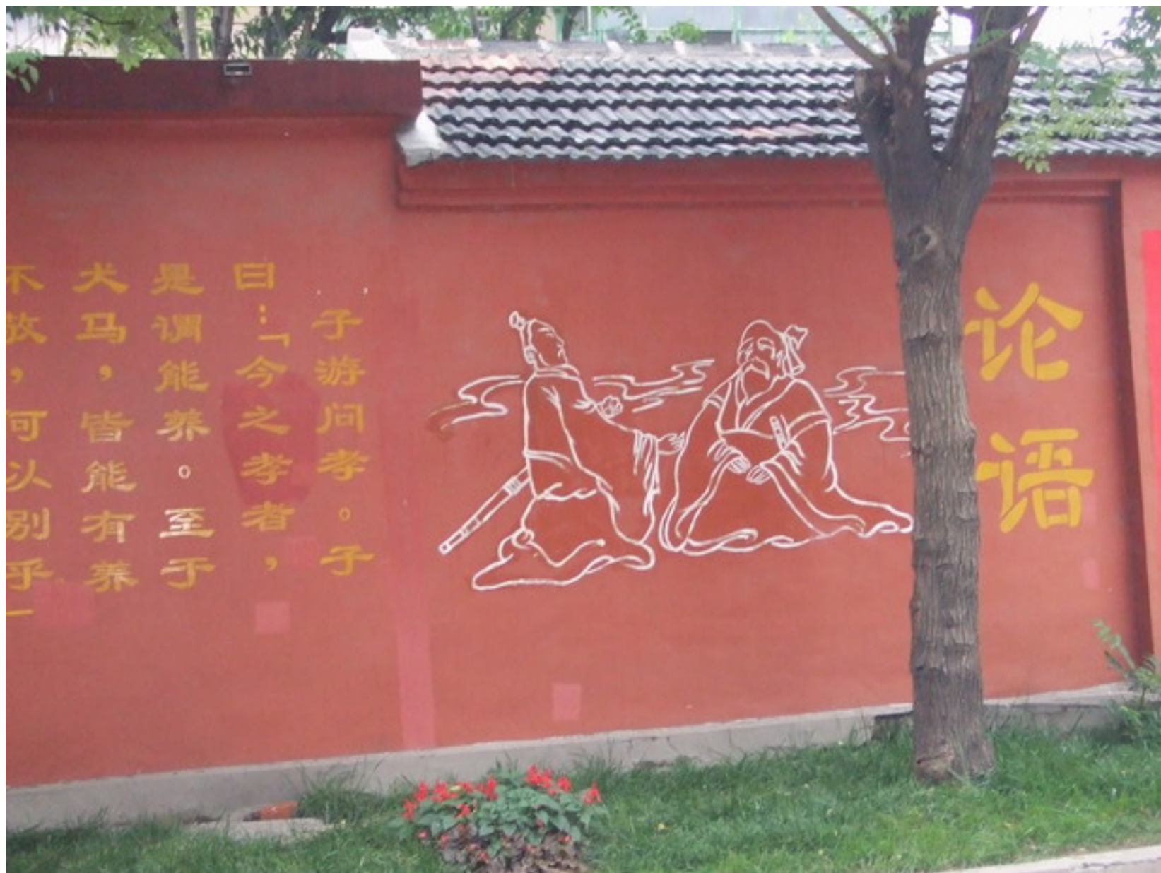
在前往博文中學的路途中，兩邊民宅牆壁上題寫『論語』的章句。