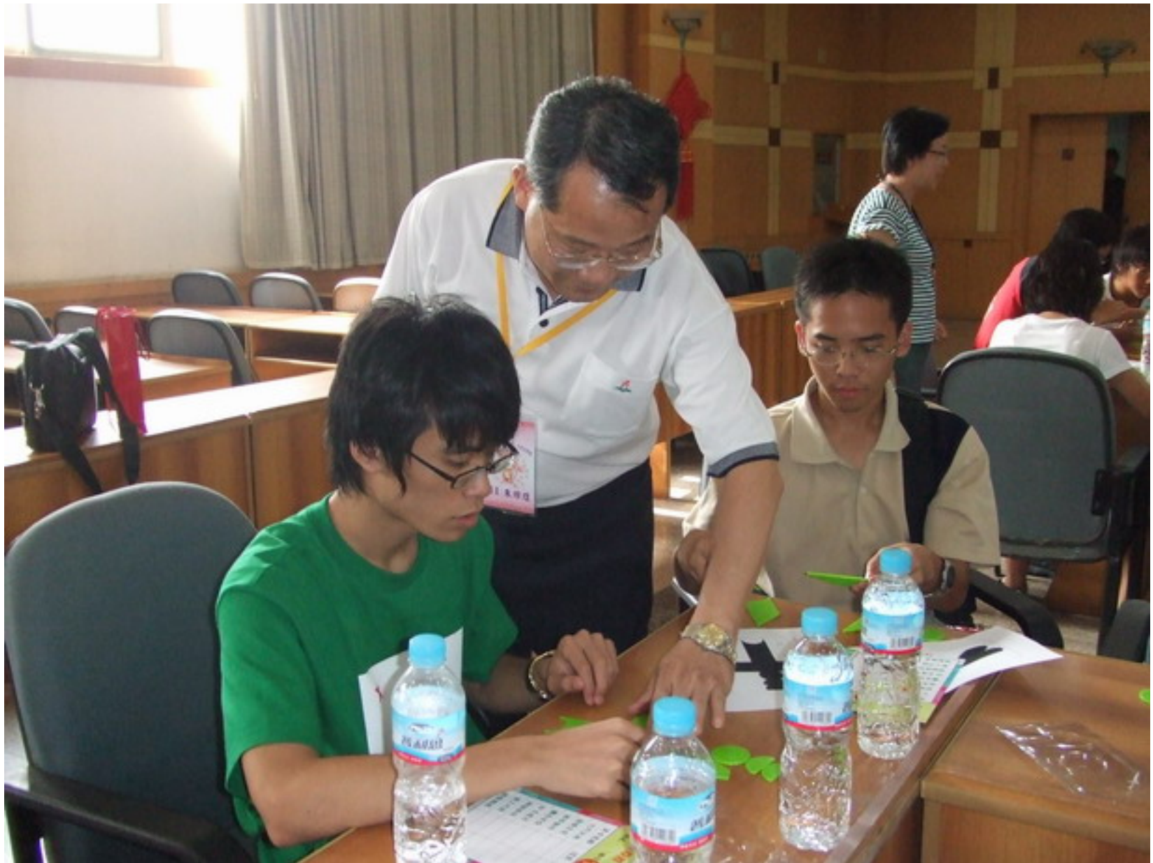
校長也一起動腦玩七巧板