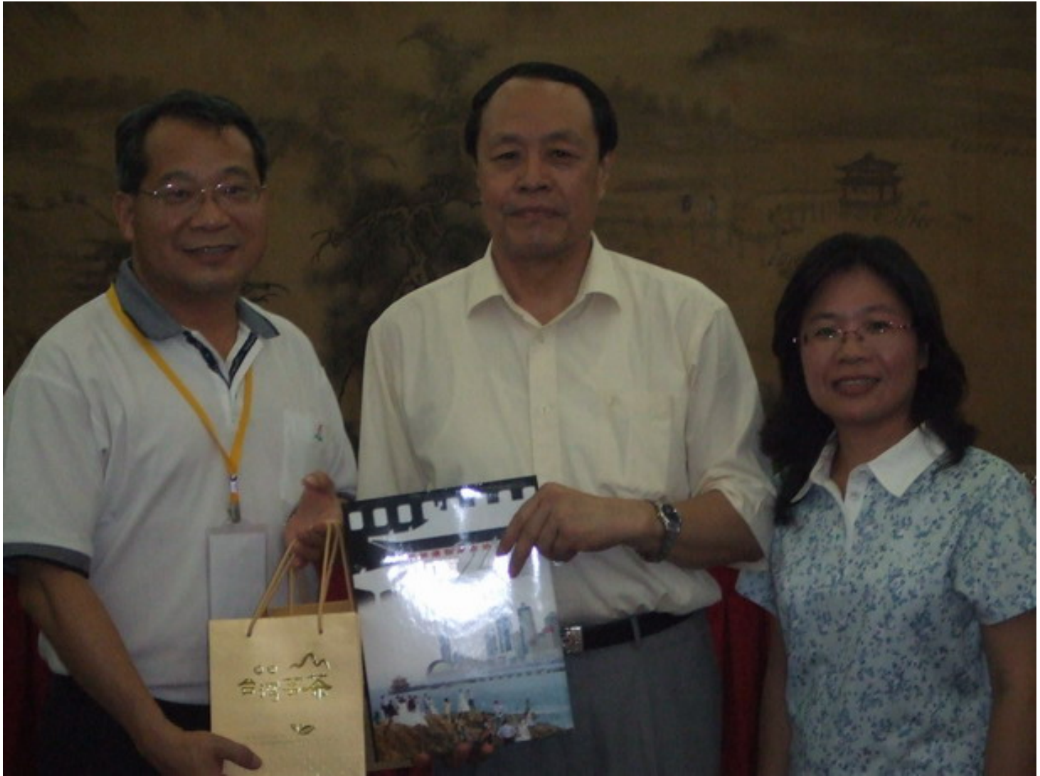
與山東省國台辦副主任嵇建寶合影