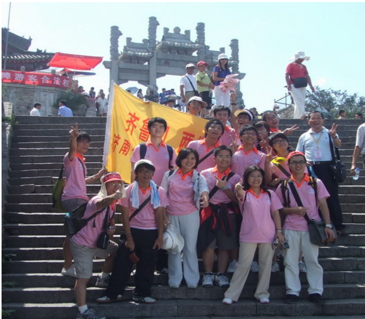
我們到達泰山的第一站 — 天街。