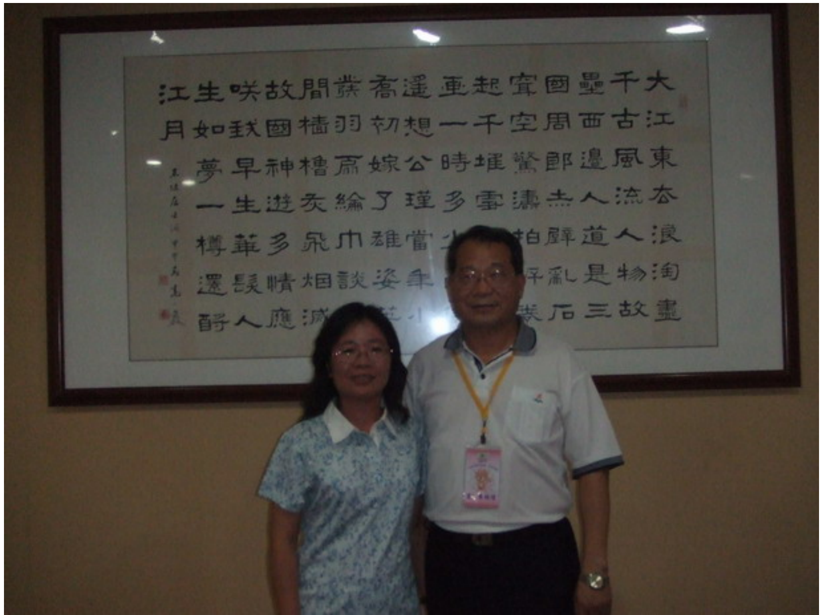
與校長在餐廳合影