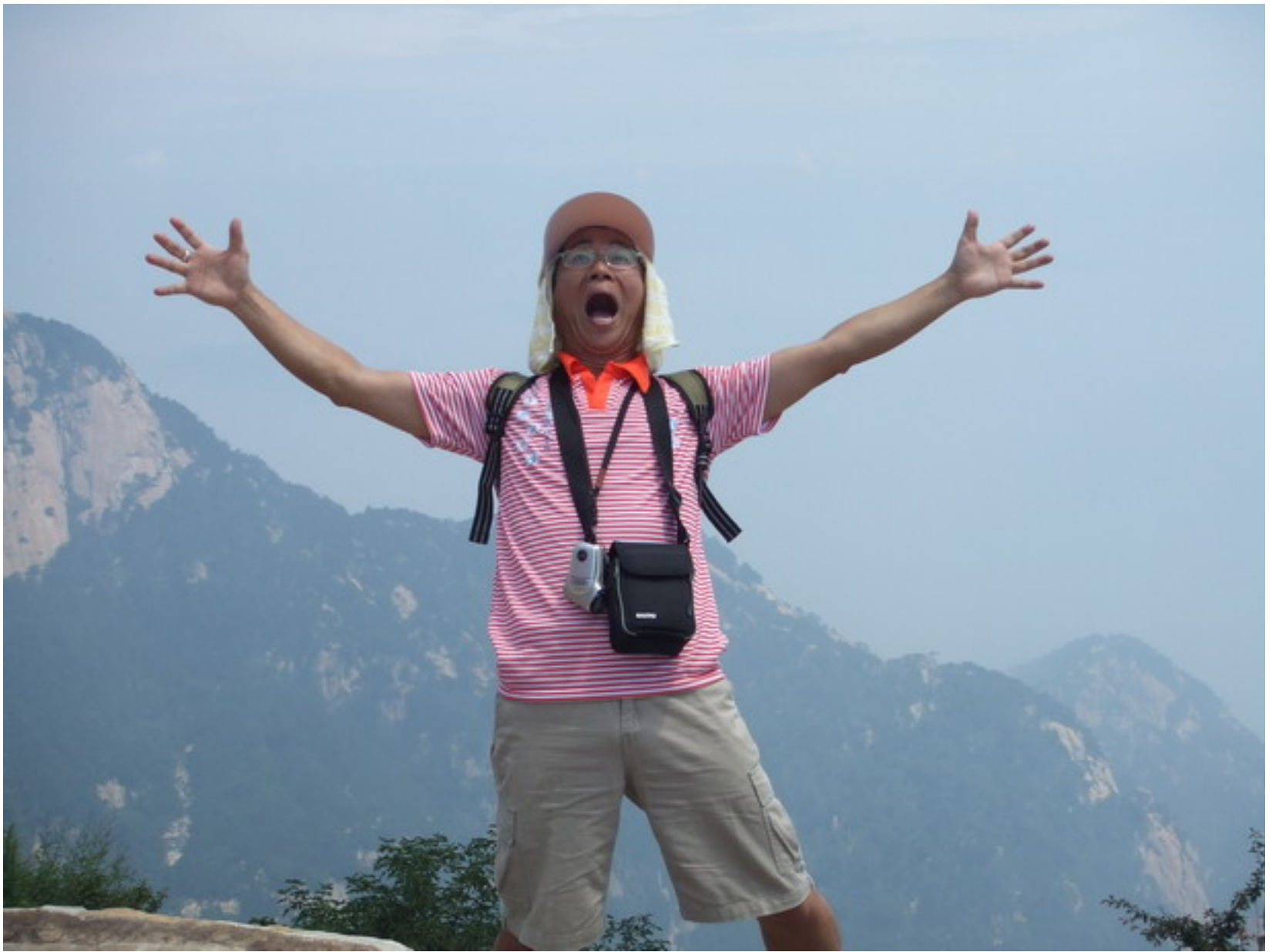
明照老師總是有驚人之舉