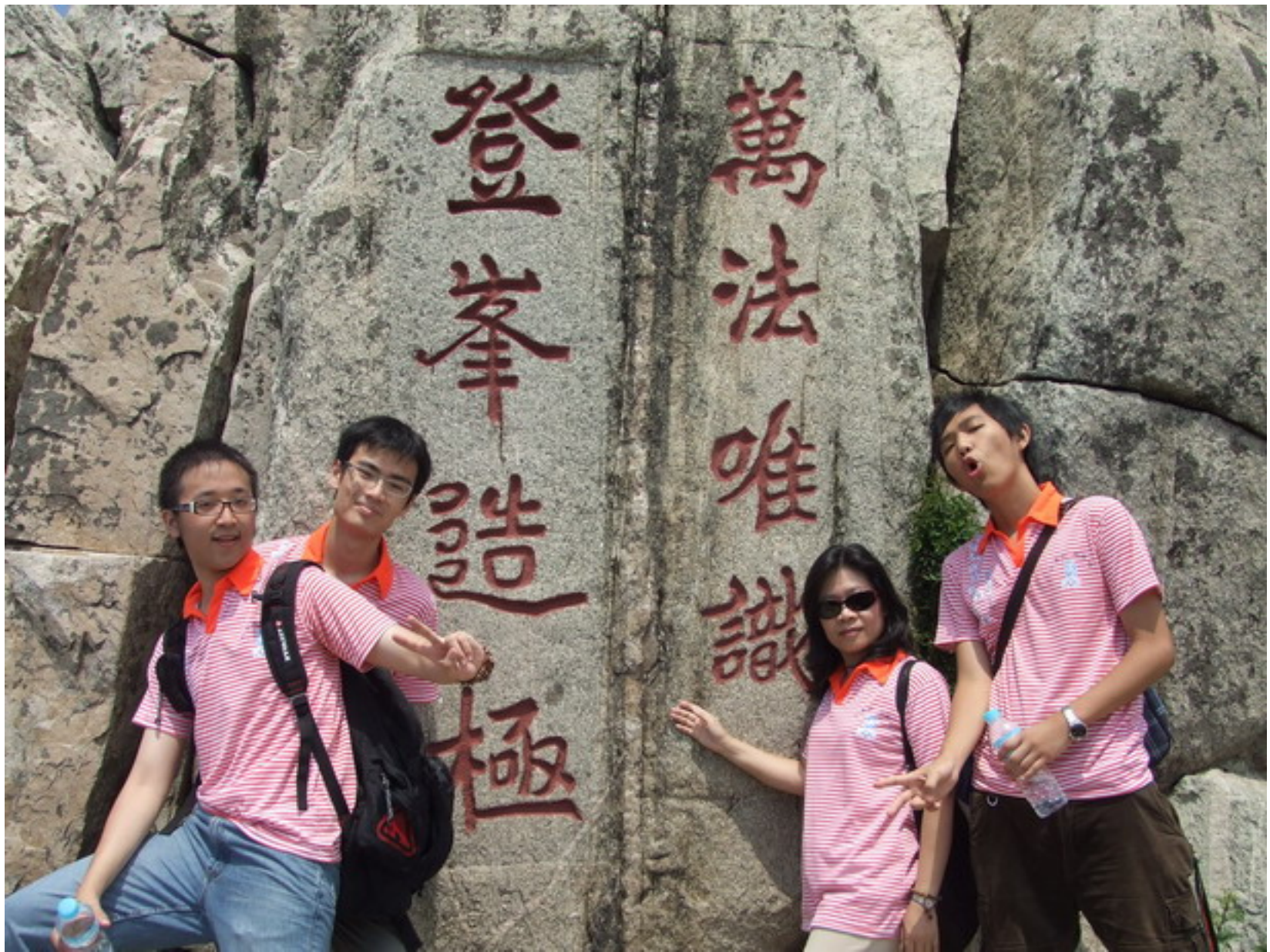
與323的子弟兵們合影