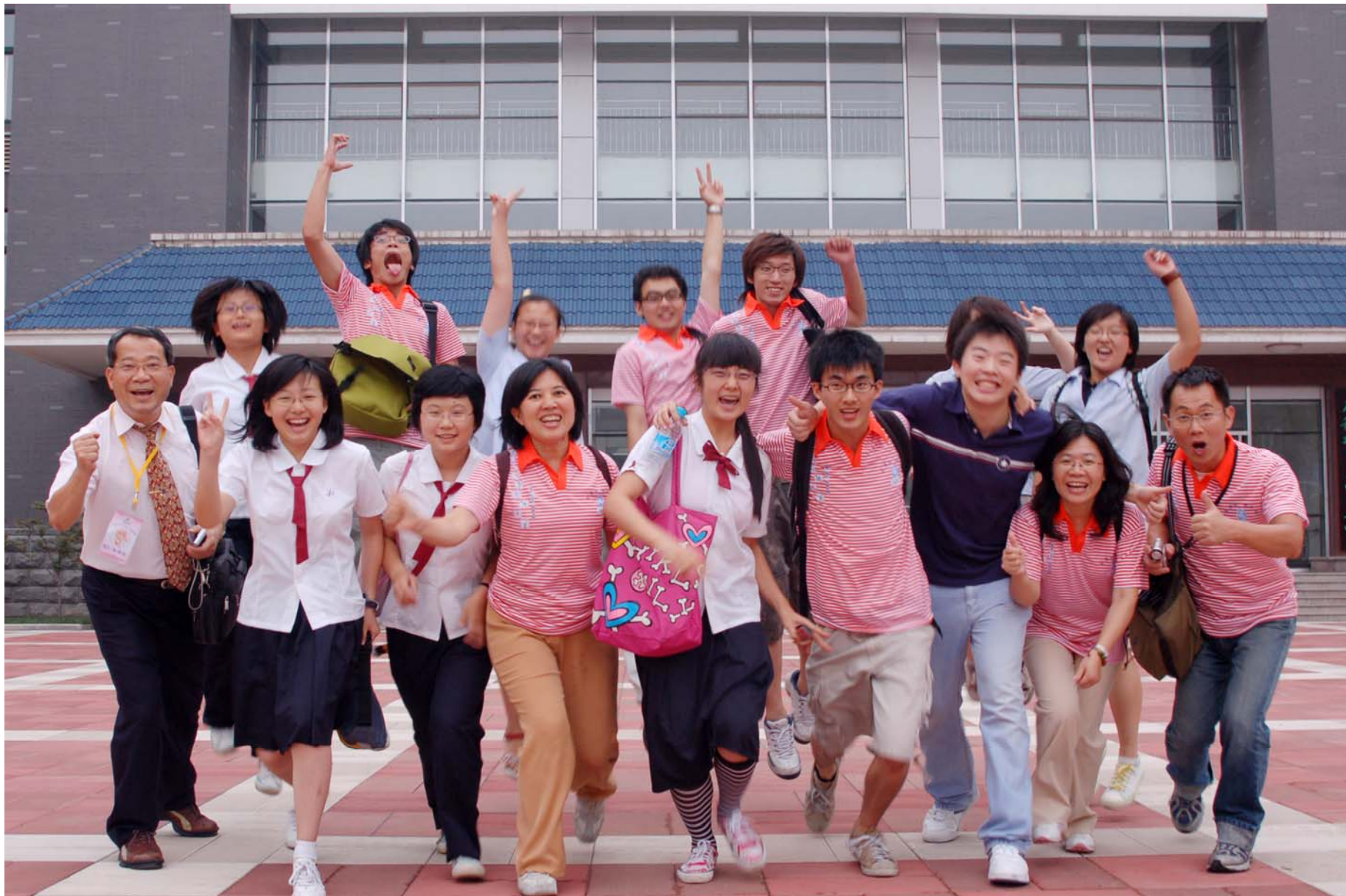
交流愉快的相見歡（大陸記者拍攝）