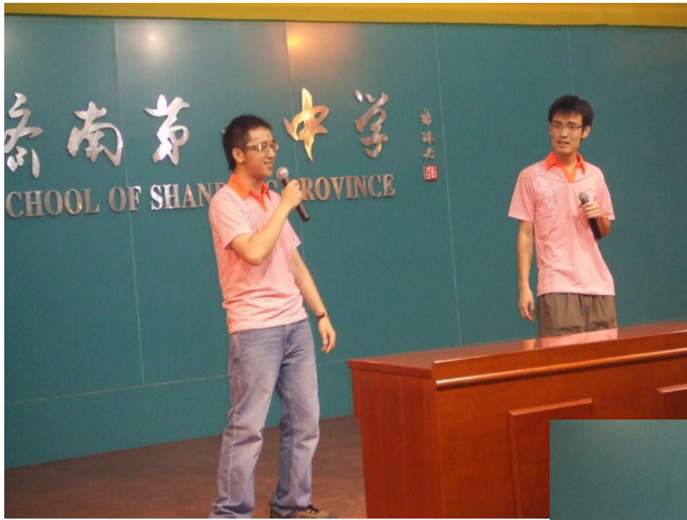
相聲表演： 孔子的七十三弟子