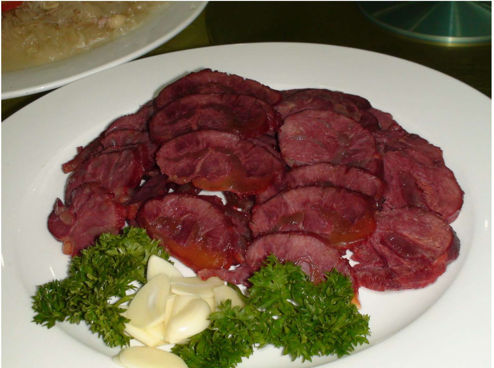
『天上龍肉，地上驢肉』