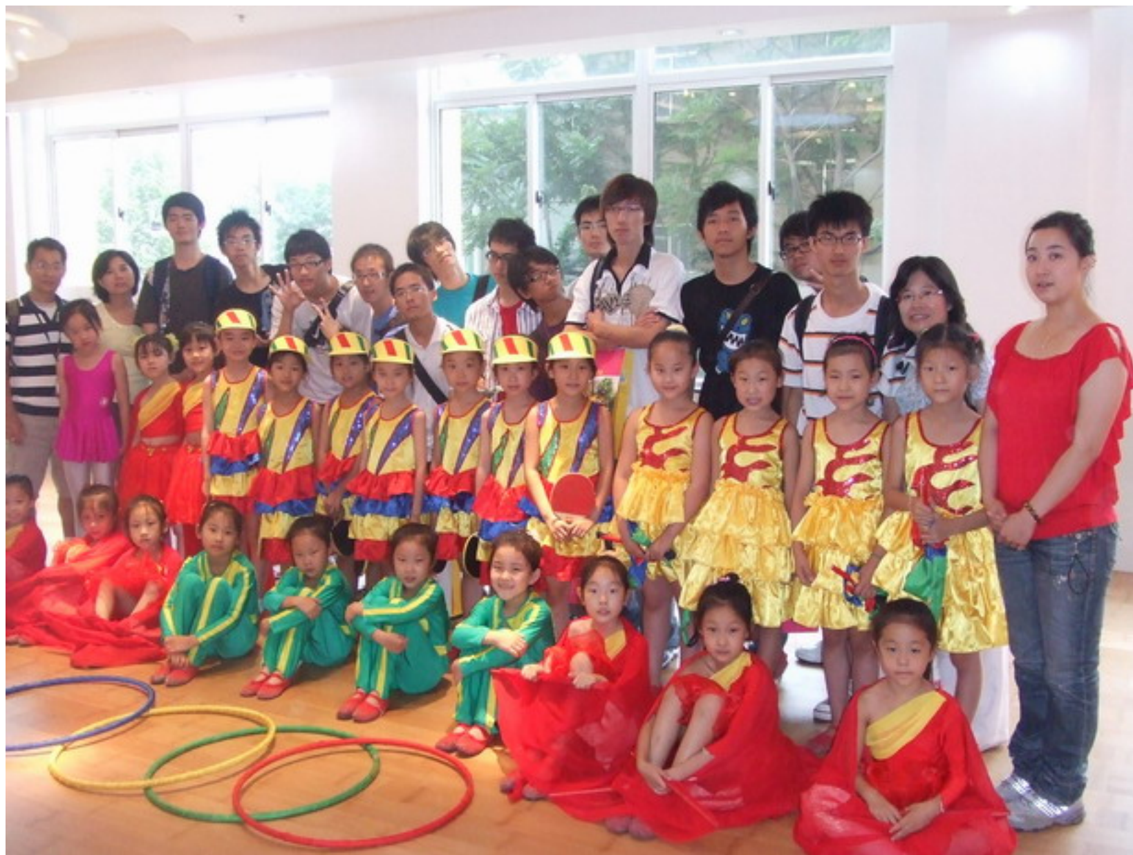
這群六、七歲的孩童，正在為奧運的到來歡欣舞蹈。