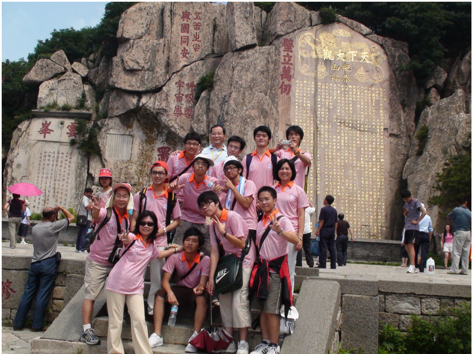
大夥的興致昂揚，齊聲高唱成功高中校歌，引來旁觀人潮。