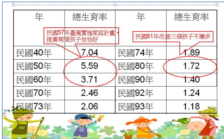
表1 歷年臺灣生育率