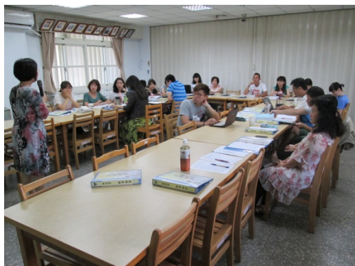
103. 09. 17(三) 09:00-12:00 四維樓二樓 社會科 教學檔案製作研習