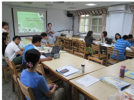
103. 09. 17(三) 09:00-12:00 四維樓二樓 社會科 教學檔案製作研習