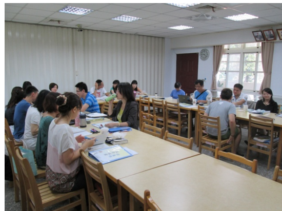
103. 09. 17(三) 09:00-12:00 四維樓二樓 社會科 教學檔案製作研習