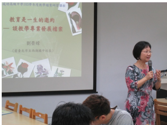
103. 09. 17(三) 09:00-12:00 四維樓二樓 社會科 教學檔案製作研習