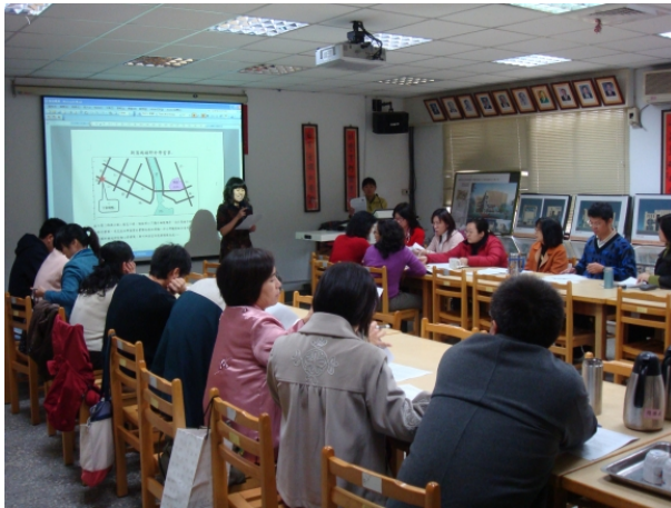
971224 社會科教學輔導教師設置知能研習