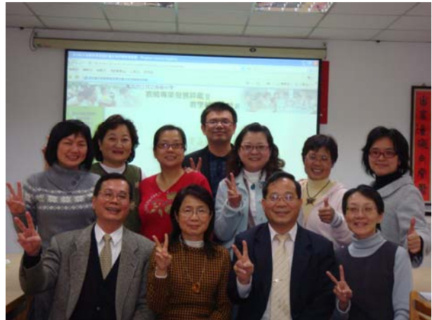
教學輔導教師群與行政團隊歡喜付出