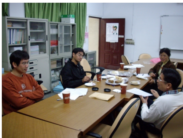
971223 與資深教師經驗分享