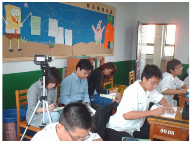
夥伴教師及新進教師們認真作筆記