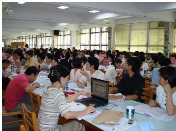
960629 校務會議通過本校教學輔導教師設置實施計畫