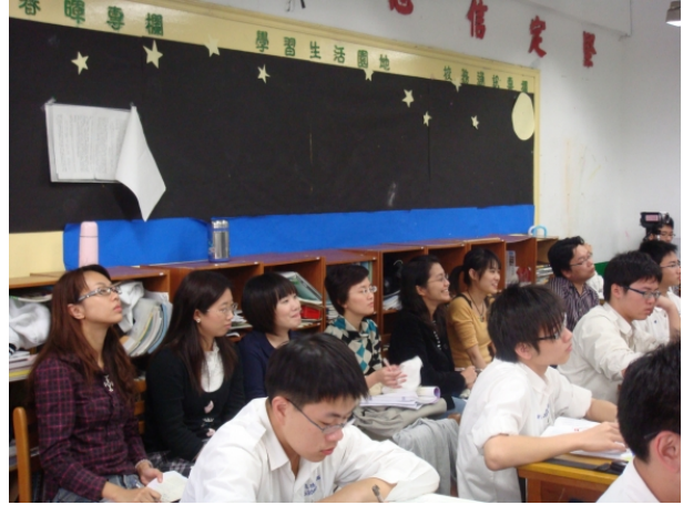
夥伴教師及新進教師們全神貫注