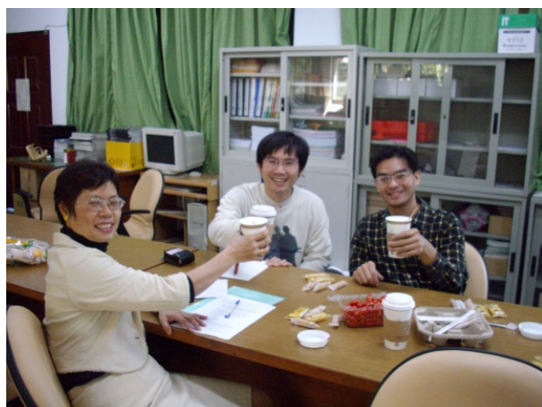
971202 經驗分享—「喝咖啡打氣！」