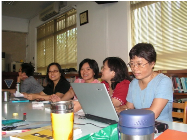
敬業的教學輔導教師群