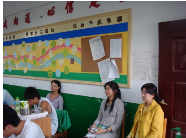
資深教師、夥伴教師及新進教師入班觀察