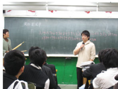
同學背出圓周率至小數點六十位