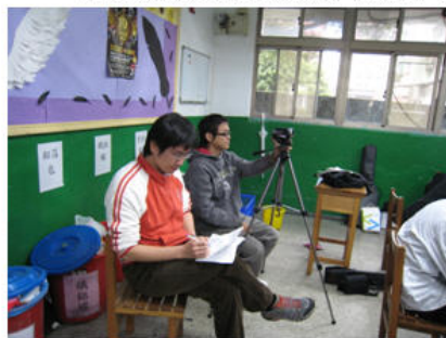
夥伴教師入班觀察