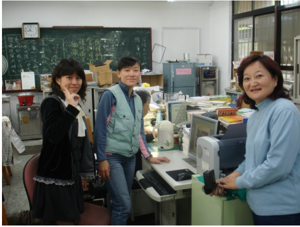
「姐妹三人同在一間辦公室，太棒了！」