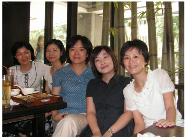
970910 國文科教學經驗分享