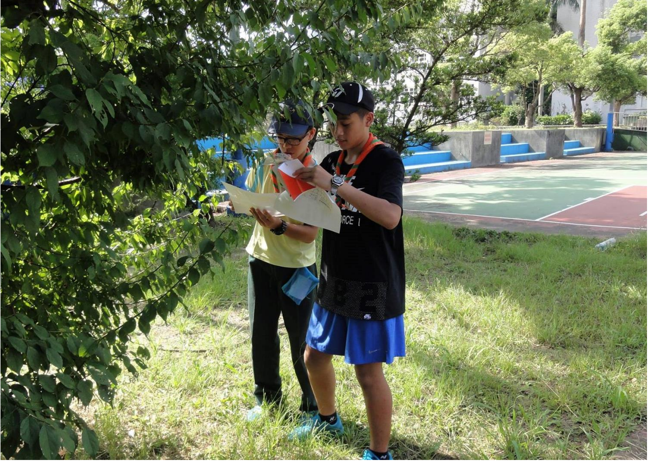
於定向越野活動時練習地圖判別