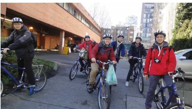
於加拿大自行車時合照