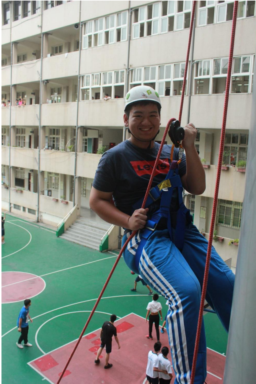
於成功高中校內進行垂降體驗