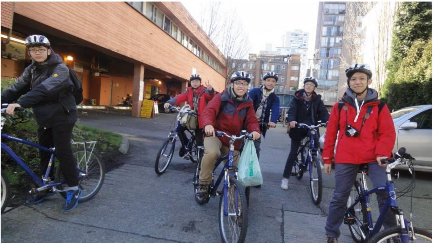
加拿大雪地露營後自由行行程