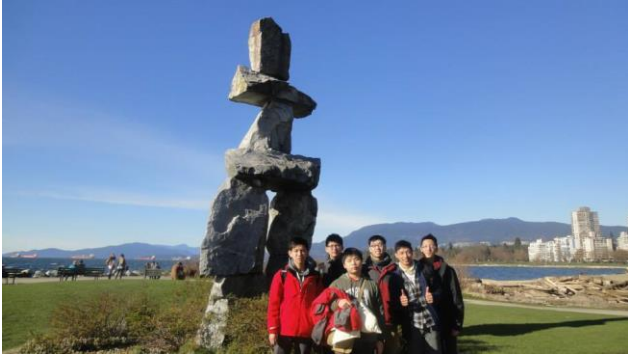
於加拿大自行車時合照