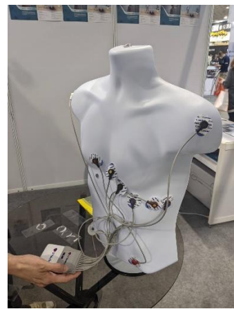
▲「12 導程心電圖」示意圖