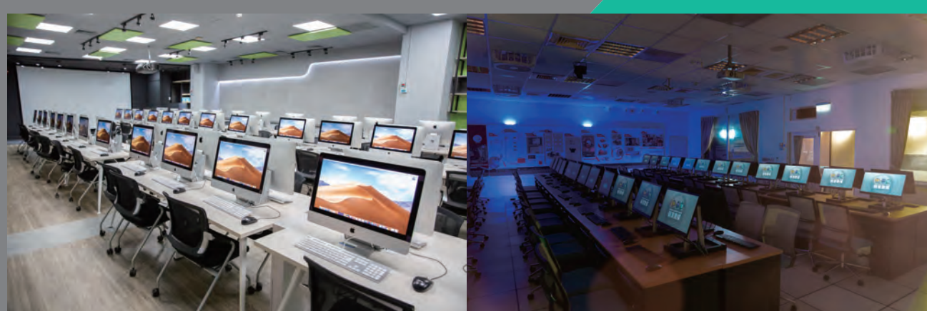
▶▶ MAC 影視特效後製電腦教室

● 本系與許多影視傳播、電腦動畫、電腦遊戲、AR 擴增與 VR 虛擬實境業者均有密切產學合作關係，如東森媒體集團、三立電視、民間全民電視、mono 親子台、台中捷運公司、映畫傳播、福相數位電影製作、凌雲傳播、乾坤一擊創意工作室、龍特創意、沌與設計、果島思設計工作室、... 等，未來將繼續加強產學合作，與更多業者建立夥伴關係。